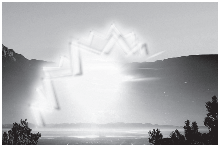
2. ábra: kísérlet a migrénaura megragadására.

mármint tapasztalatfüggő tárgyként, amely érzéki tulajdonságokkal rendelkezik. Az utókép és a migrénaura ugyanis pont ilyesfajta dolgoknak látszanak . Az érzetadat-elmélet szerint egy paradicsom észlelésekor az észlelt piros valójában egy érzetadathoz tartozik, de az élmény maga mást sugall: tudniillik azt, hogy a paradicsomhoz tartozik. Ahogy fentebb érveltem, a helyzet más az utóképek és a migrénaura esetében.