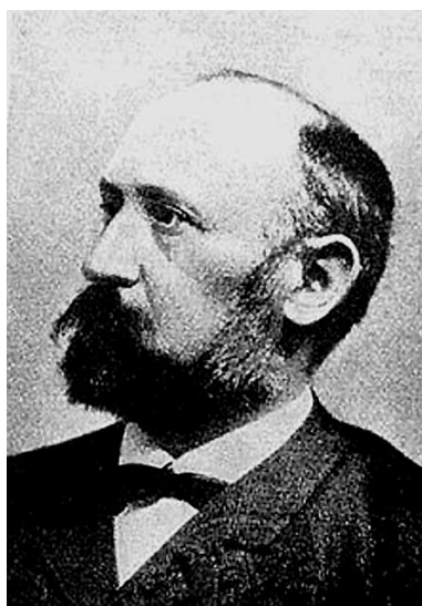
Böhm Károly, a Magyar Philosophiai Szemle alapító szerkesztője (1846–1911)