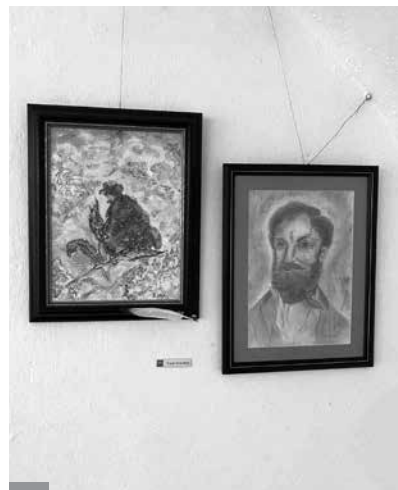
Treier Erzsébet munkái