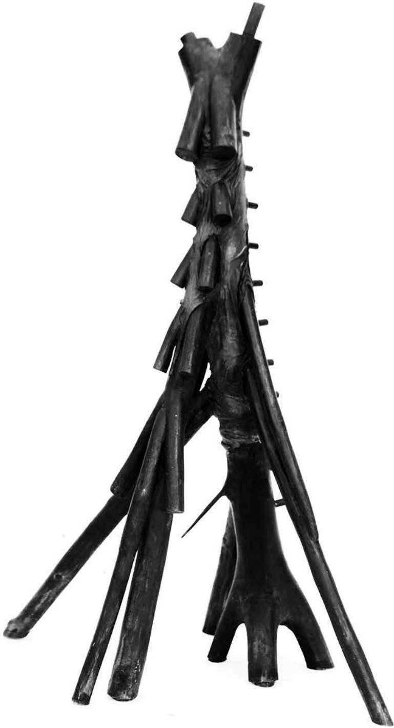
| Szlaukó László: Üzenetvivő