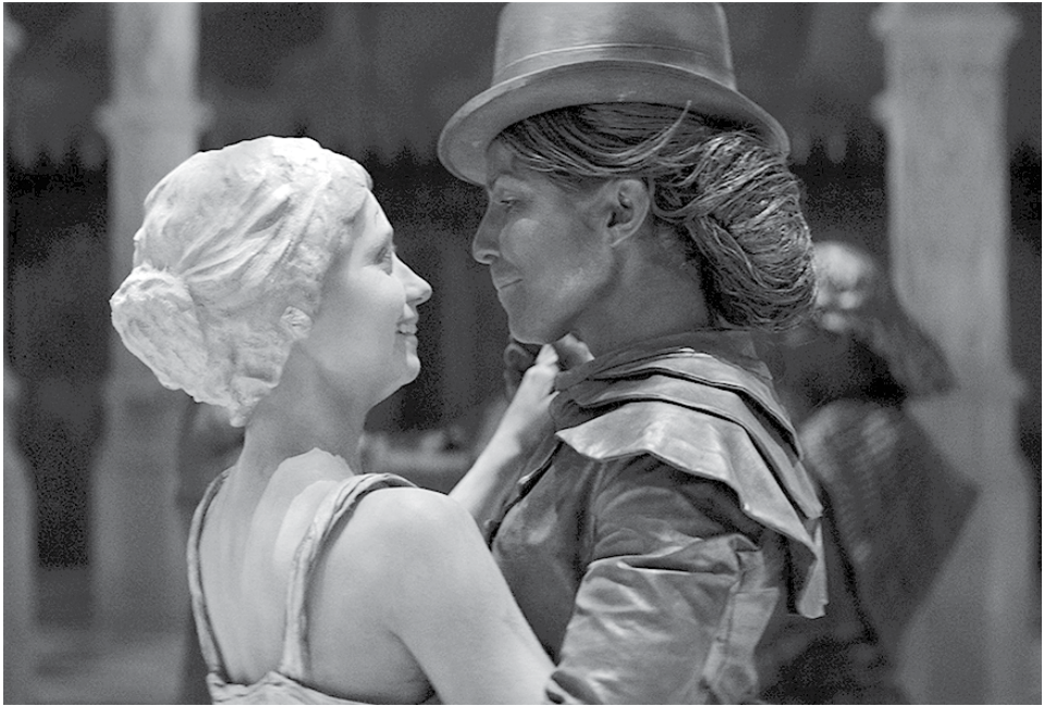
Jelenet a Köszívek című alkotásból

egy alakja, Alexandru Ioan Cuza. A fiú az ő vezetésével ismerkedik meg a múlttal. A film nem értékelhető klasszikus moziként, inkább egy szépen kivitelezett történelemóra legendákkal és magyarázatokkal megtűzdelve. Mellette a klasszikus fantasykat eleveníti fel az ember–elf konfliktust a középpontjába állító Warlord (Háborús vezér) című angol alkotás. Ennek alap-története szerint az emberek elfoglaltak egy elf várost, és ott diktatórikus módszerekkel uralkodnak. A népnyűzó, kegyetlen hatalom megdöntésére emberek és elfek együtt indulnak el. A filmen látszik az alacsony költségvetés, a látványvilága inkább a tévés produkciókat idézi. A görög 3 Moirai (Három Moira) az előzőektől teljesen eltérő, akár kísérletinek is nevezhető alkotás: egy fantasztikus elemekkel átszótt fekete-fehér némafilm, amely a címéből is sejthetőn a sors kérdéseivel