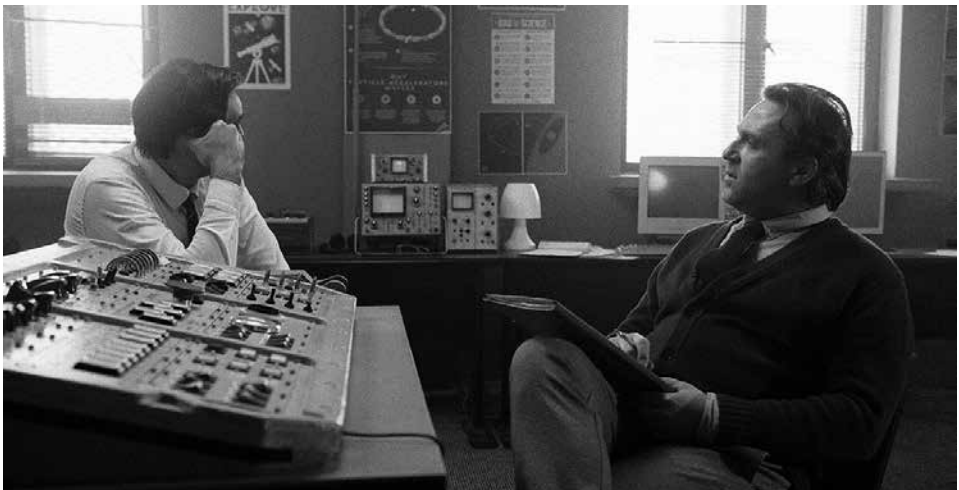
A bizonytalanság elve