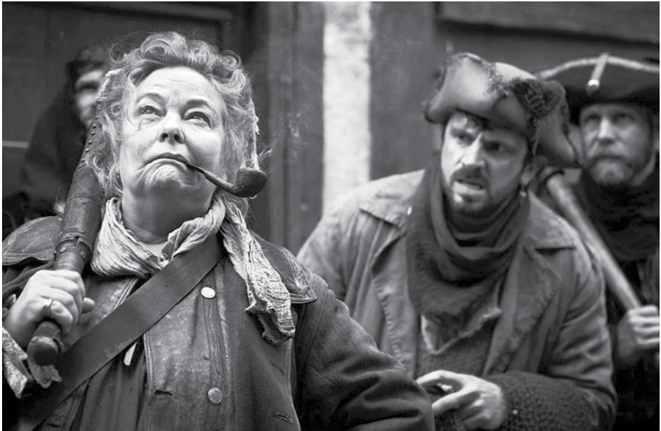
A koronaherceg és a zsarnok visszatérése

A Downsized (Feltöltve) alkotás, a brit Ed Willey filmje különös díszletezéssel hívta fel magára a figyelmet. A főszereplője egy szoftvermérnök, aki a felesége digitális maradványait próbálja megmenteni az utolsó munkanapján. Persze nehézségekbe ütközik, és egy különös megoldáshoz kell folya-