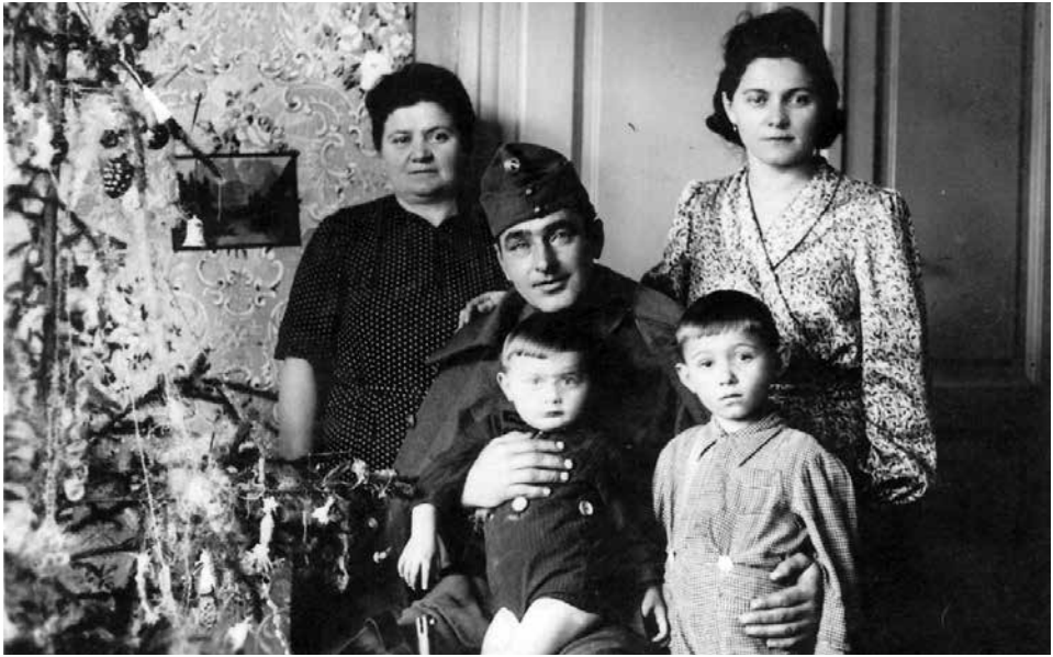
1942-es karácsonyi felvétel a frontra visszainduló katonával, ekkor láthatta az apa utoljára a családját, fél év múlva már nem élt

soha nem is voltak igaz szavak. 1944 augusztus 23-a után a románság úgy érezte, eljött a revans ideje.)