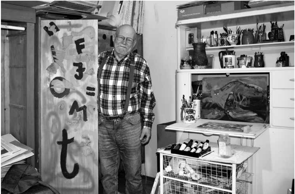
A pálfai házban a szekrényajtó is alkotás

– Voltak mesterei, vagy mindig a saját útját járta?