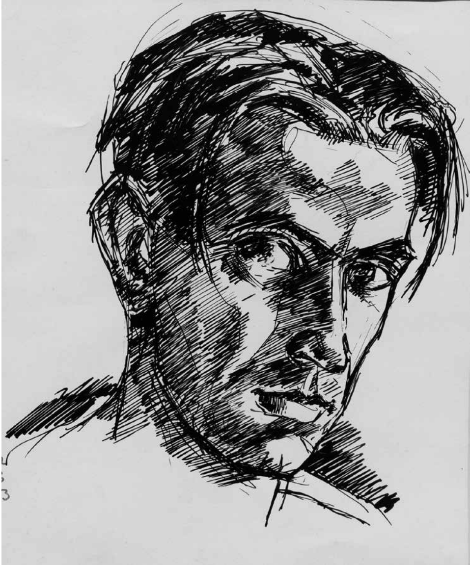
Korai önarcképek 5