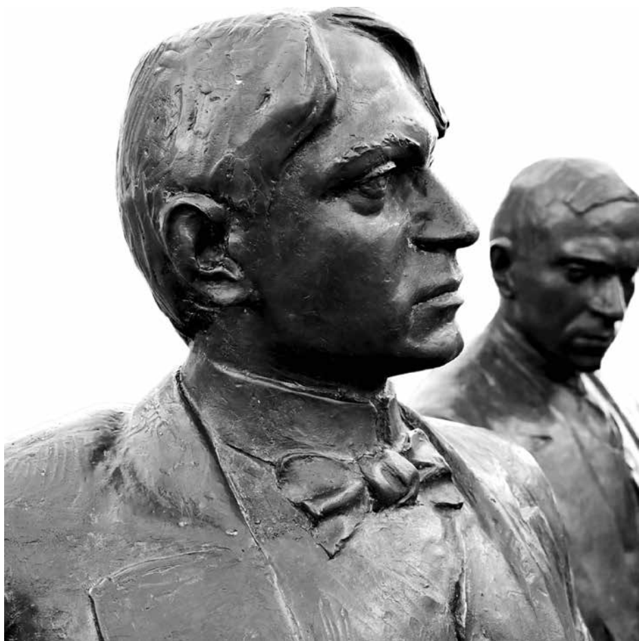
A Holnaposok szoborcsoportja, részlet (Nagyvárad)

újítás, gazdasági növekedés, egyéni gyarapodás, ha közérzetünk egyre rosszabbá válik amiatt, hogy egymást semmibe vesszük. Van egy mondás: az ember bármivé válhat, még emberré is. A gyalogosnak tehát egyetlen lehetősége van az emberré váláshoz: ha anyagiból szellemivé változik.