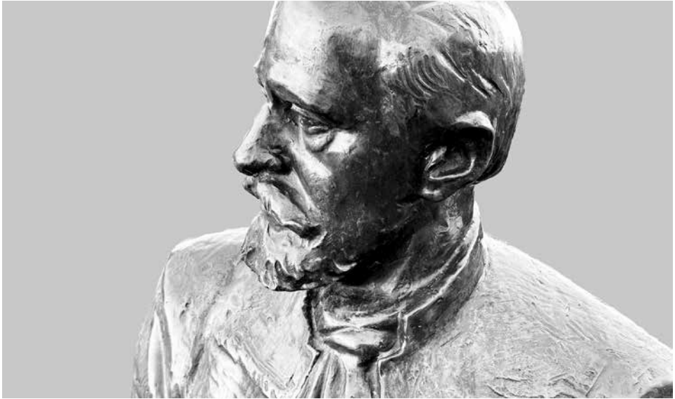
Irinyiék szobra, részlet (Bihardiószeg)