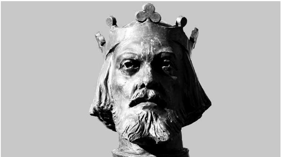
Szent László mellszobra (Magyarremete)