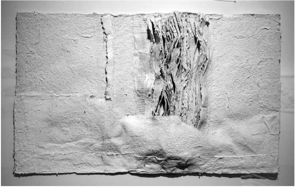
Márton Katalin, Rétegek meséje II. (merített papír, 2020)