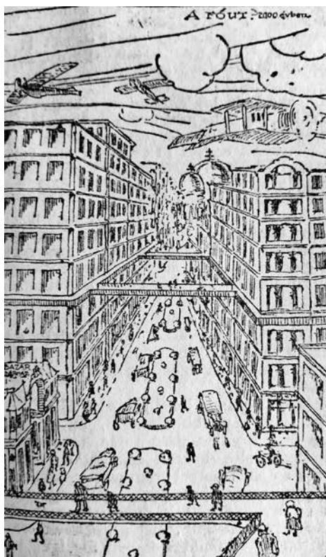
A Főutca képe