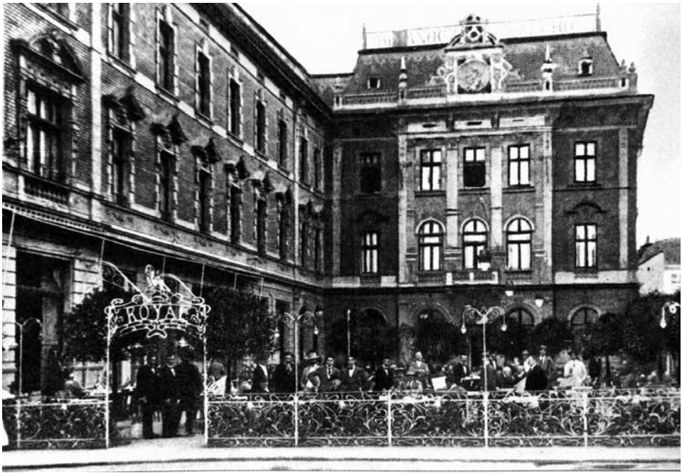
Rimanóczy Szálló és Gőzfürdő