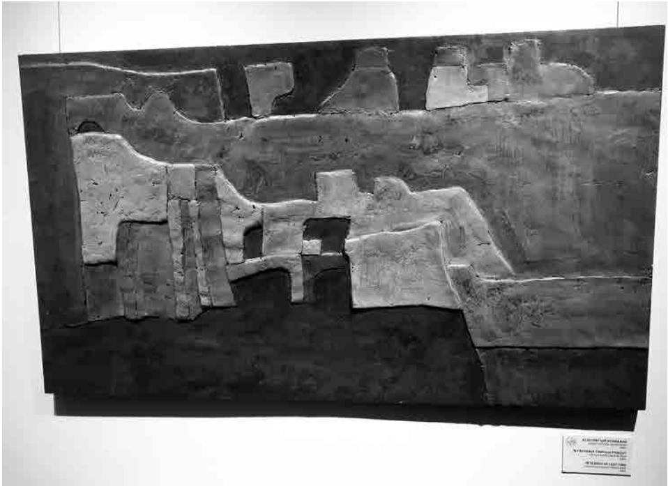
Az eltűnt idő nyomában

zése napján egy olyan személynek ítéli oda, aki hozzátesz valamit az erdélyi képzőművészet ügyéhez. Fájdalmasan felemelő érzés volt elsőnek elnyernem és átvennem a kis szobrocskát. Ebben a pillanatban azonban arra gondolok, hogy az igazi öröm az lenne, ha a nevét viselő díj helyett magával a Mesterrel egymás kiállításait nyithatnánk meg itt, Erdélyben vagy szerte a világban.”