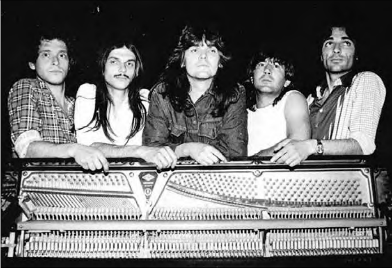
A zenekar Temesváron, 1982-ben

Ebben a közegben bennünket nagyon kevesen kerestek meg. A szoftok megjelenése előidézte azt, mivel elég drágák voltak, hogy a producerek ne fizessék ki az úgynevezett „művészeknek” a felvételeiket, erre szoktatták őket... Ezenkívül volt pár haláleset a tagok családjában, ezek miatt is ritkultak a találkozások, a próbák. Megpróbáltuk önállósítani magunkat anyagilag, ugyanis a '90-es évek elején az együttesnek banki adósságai voltak, ezért maradt meg a zene hobbiként. Volt vagy öt-hat év, kb. 2003-ig, amikor nagyon keveset koncerteztünk, és ritkán is találkoztunk. 2003-ban volt egy visszatérő bulink Bukarestben, az Arenele Romanéban, amire nagyon sokan jöttek el, és visszaadták az önbizalmunkat. A 25 éves jubileumi koncertünk után pedig egyre több felkérést kaptunk. Úgy érzem, hogy ez az említett periódus válságos időszak volt, de nemcsak számunkra, hanem az egész rockzenei élet számára világszerte. Viszont türelemmel, ambícióval, a zene iránti szeretettel és alázattal sikerült átvészelnünk ezt is.