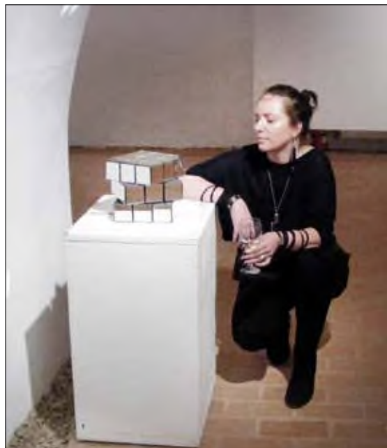
A trükkös tükrös bűvös kocka és alkotója