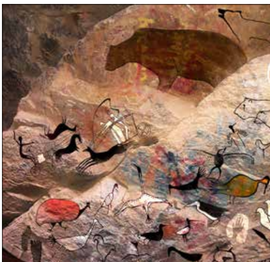
Természet és ember közelségét megidéző illusztrációk. Hajnal a vadonban