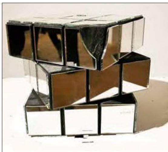
Magunkat rakhatjuk ki a tükörképekből – erre tanít a Lecke a kockáról

Különbé stílusok, műfajok iránt érdeklődik. Hangulattól függ, mi módon fejezi ki mondanóját. A festészet távolabb áll tőle, ehelyett inkább színes grafikákat kreál. „Nagyon szeretem a kézzel készített művészkönyveket. A könyv mint téma újra és újra előbukkan az életemben. Tanultam könyvkötést, -varrást is. Sok örömet ad egy ilyen könyv szerkesztése, illusztrálása, saját kezű elkészítése. A kommersz dolgok mellett mindez sokszor elfelej-