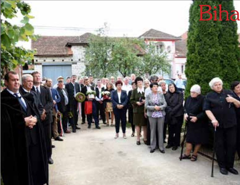
A jánosfalvi magyar közösség emlékhellyel gyarapodott