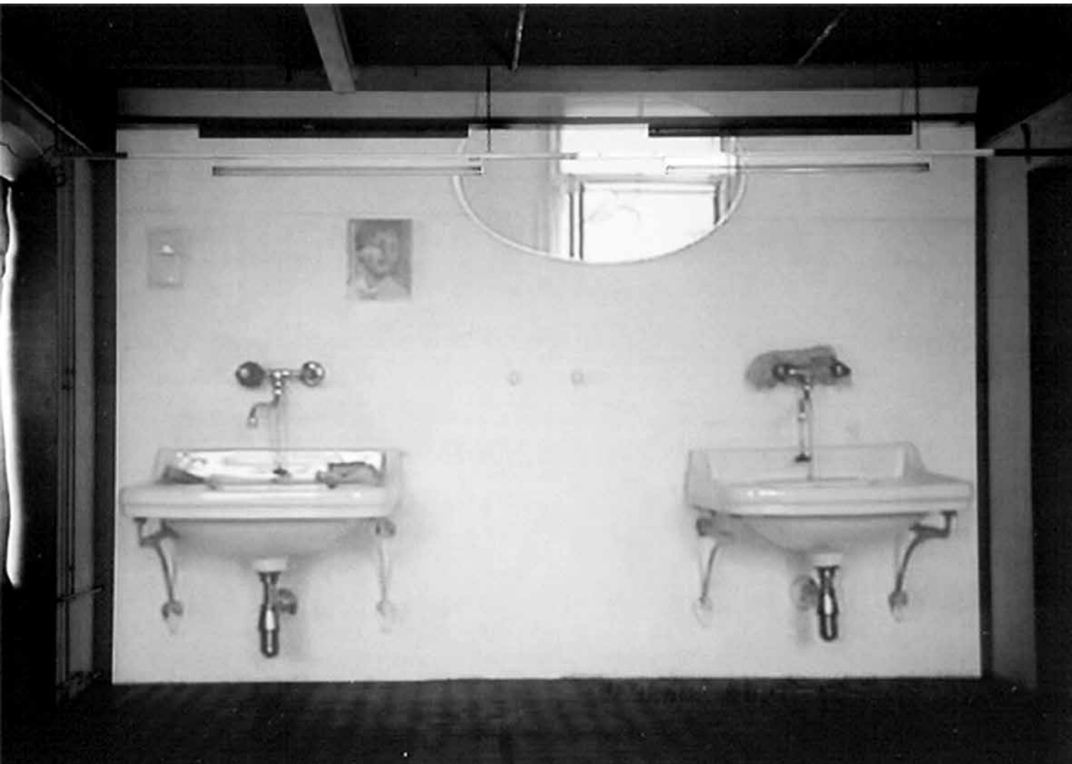
Move-able (kultúrkontakt), 2001, installáció, vegyes technika