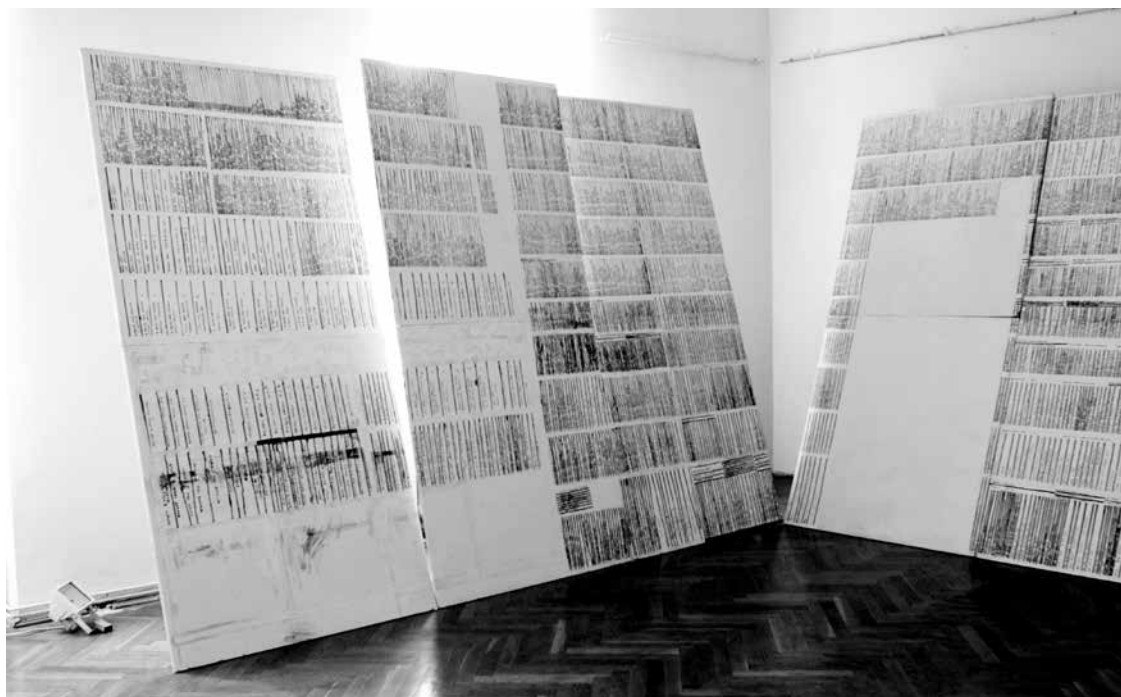
Walking library, 2008, installáció (részlet)