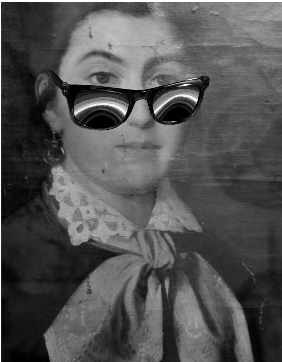
Illusztráció A tizenhetedik vendégpapucs c. meséskönyvből, 2004