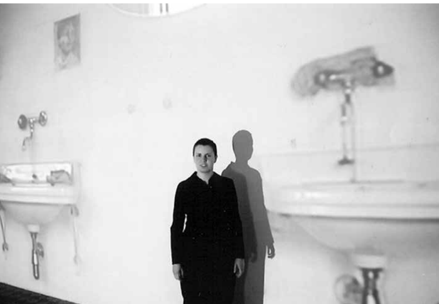
Move-able (kultúrkontakt), 2001, a művész a vetített kép előtt