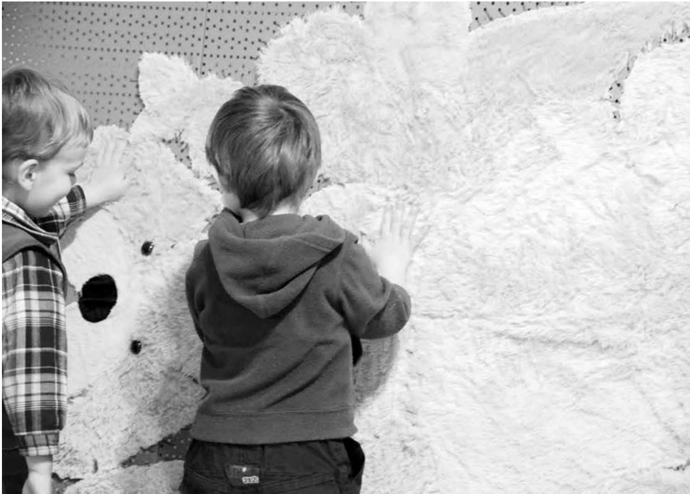
Vakcina, 2011, installáció, vegyes technika