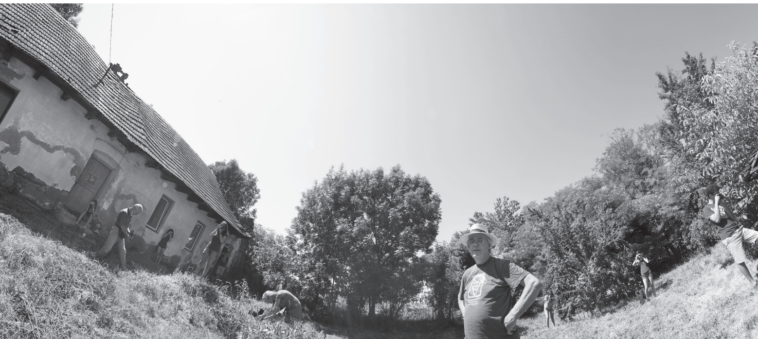
Homoródmási önarckép Dénes Ibolyával, 2012, 50 × 219 cm, archív pigment nyomtat, a szerző tulajdona