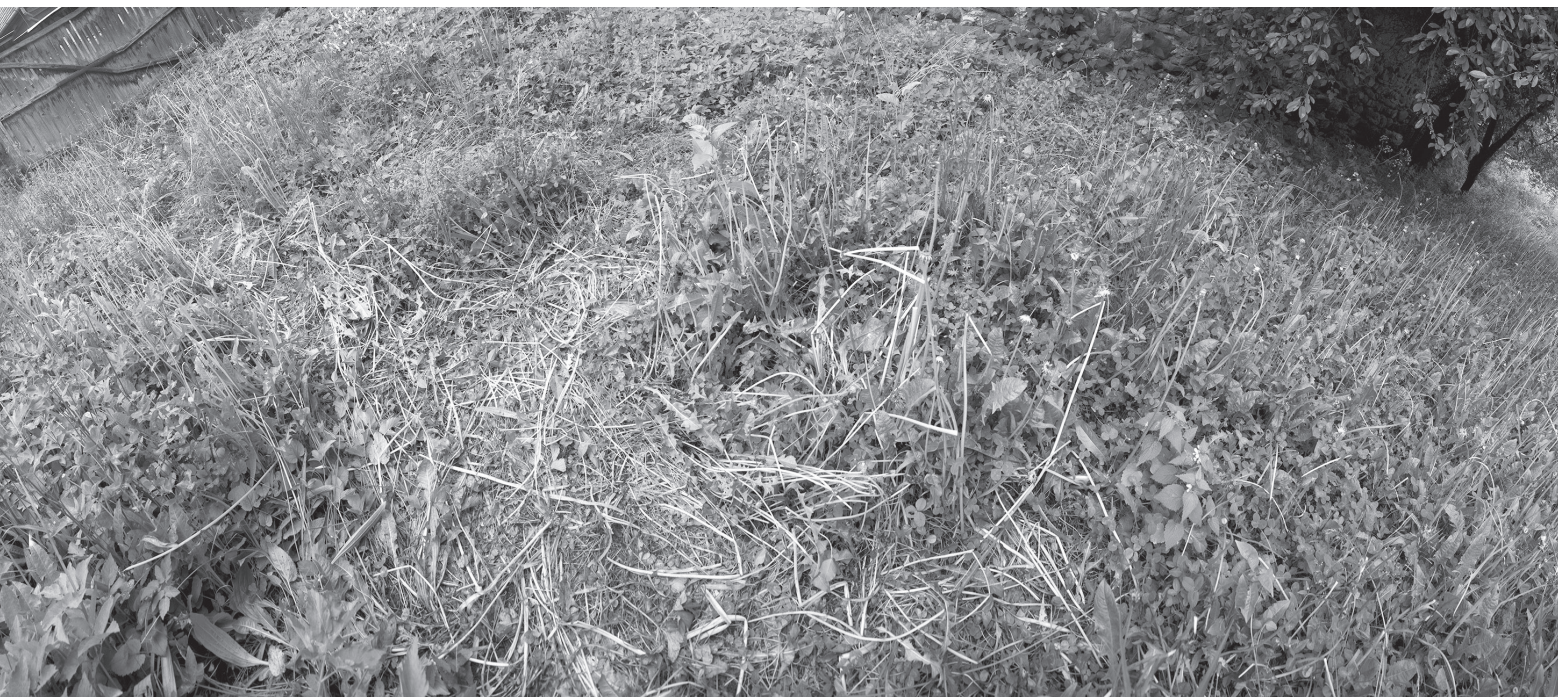
Állatkerti önarckép, 2010, 41 × 192 cm, archív pigment nyomtat, a szerző tulajdona