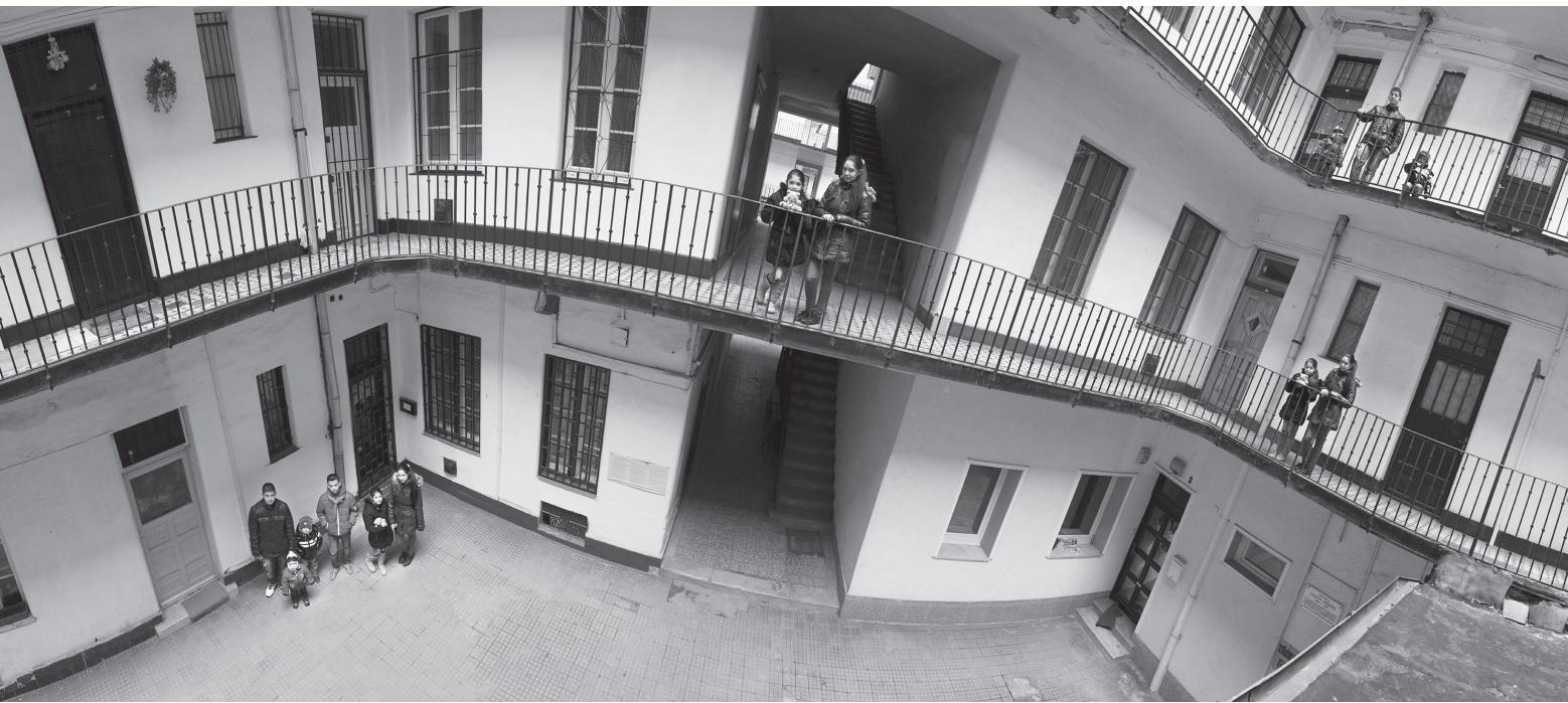
A százéves Teleki tér 3., 2013, 50 × 225 cm, archív pigment nyomat, a szerző tulajdona