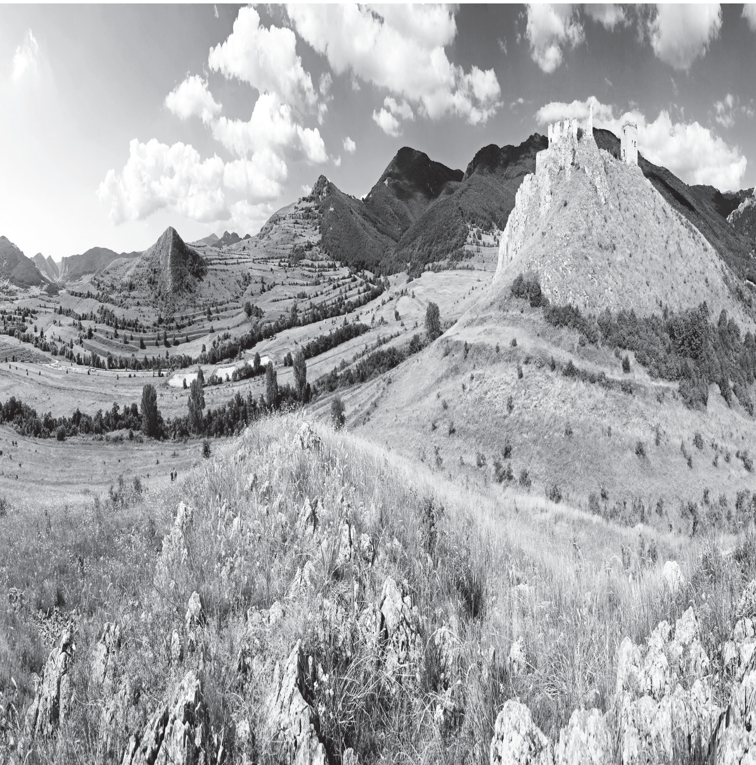
A torockószentgyörgyi vár, 80 × 154 cm, archív pigment nyomat, a Magyar Kereskedelmi Bank tulajdona