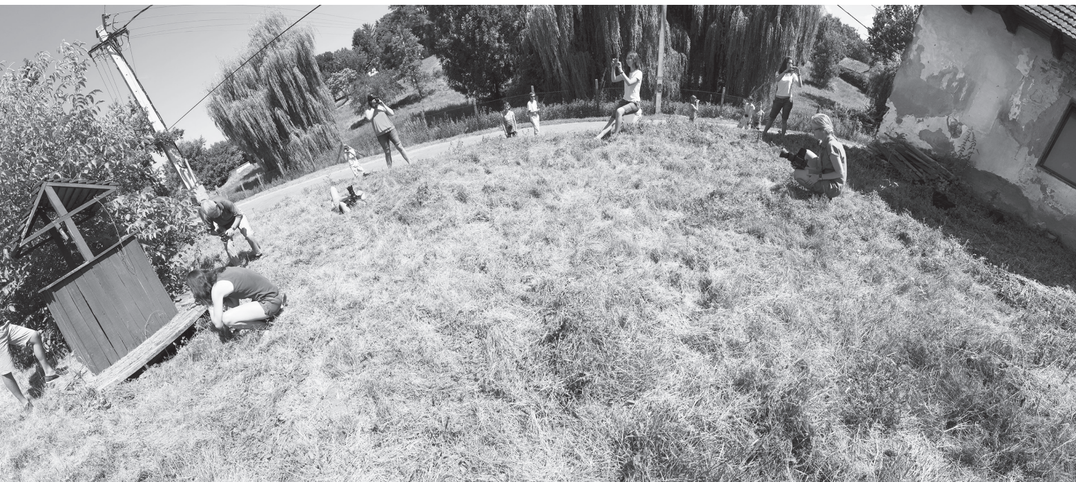
Önarckép a Fotófaluban / Telek Balázs emlékére, 2013, 50 × 223 cm, archív pigment nyomtat, a szerző tulajdona