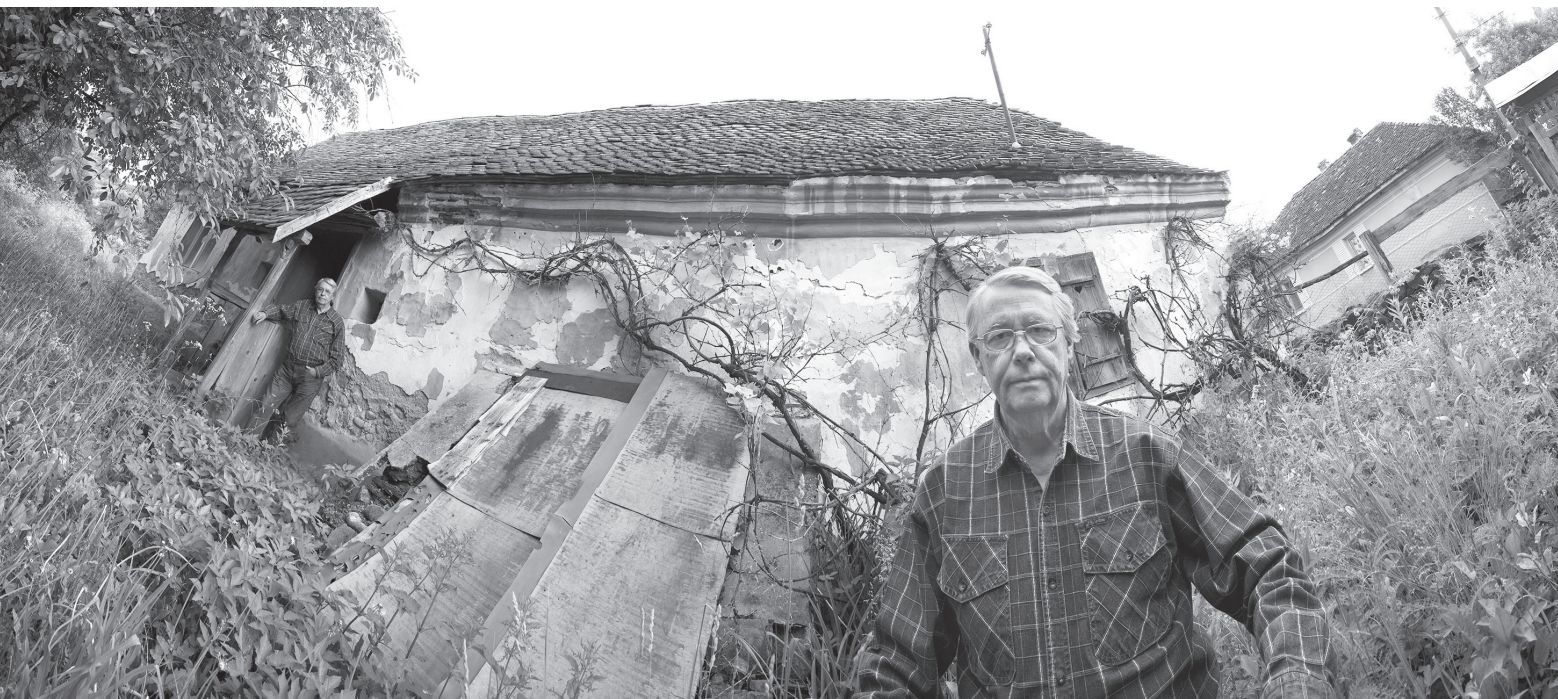
Homoródmási önarckép, 2012, 50 × 229,5 cm, archív pigment nyomtatás, a Pajta Galéria (Salföld) tulajdona