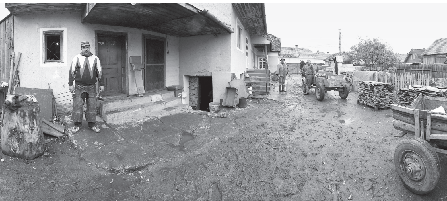
A kovács, 2010, 41 × 180,5 cm, archív pigment nyomtat, Orosz István tulajdona

BÁN ANDRÁS PhD (1951, Budapest) nyugdíjas egyetemi oktató, műkritikus. A rendszerváltás után vizuális antropológiát oktatott és a városi kortárs művészeti múzeumot vezette Miskolcon. Kutatási területe: képhasználat, privát fotó. Legfontosabb könyve: A vizuális antropológia felé (Typotex, 2008).