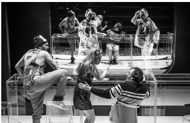
Kisvárdán után októberben Gyergyóban is játszotta a sepsiszentgyörgyi társulat a Samet