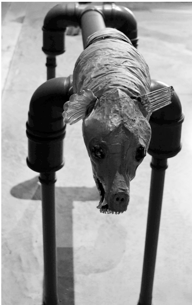
Jimmie Durham: Great Dane, 2017, kutyakoponya, muranói üveg, acélcsövek, gumi, pamut

nónak egy másik, legalább tízéves, Aerocene -nek nevezett művészi projektjébe. Ez egy olyan, „levegővel működő szoborsorozat, amely motorok nélkül, a világ legfenntarthatóbb útján úszik, csak a Nap hője és a földfelszín infravörös sugárzása révén” 10 , és úszó vagy függő hálószerkezetek, légi lakások kutatására irányul. Saraceno e művével azt kutatja, hogyan szabadulhatnánk a fosszilis tüzelőanyagoktól való jelenlegi függőségünkötől és az ezek égetése okozta környezetszennyezéstől. Időszerűségét az is bizonyítja, hogy a projektet az Egyesült Nemzetek 2015-ös párizsi éghajlatváltozási konferenciáján is bemutatták.