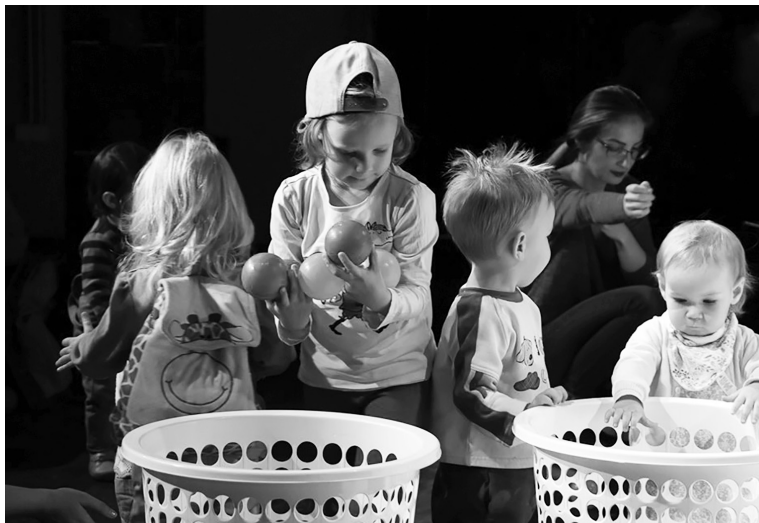
Pöttyök és babák