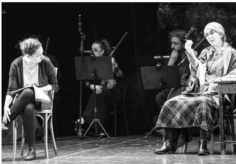
Jelenet a Jiddis? című, inkább különleges, mintsem jó előadásból