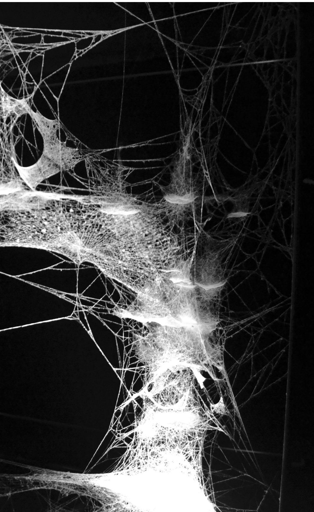
Tomás Saraceno: Spider / Web, Pavilion 7: Oracle Readings, Weavings Arachnomancy, Synanthropic Futures: At-ten(t)sion to invertebrate rights!, 2019, installáció (részlet), pókselyem, mikrofon, rezgésérzékelők, szénkeret