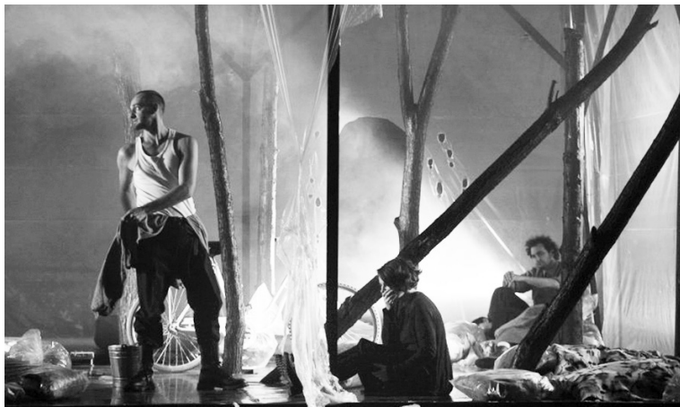
Részlet a gyergyóiak Három nővéréből . Saját környezetében jobban működik az előadás

Mert bár uniformizált világban vagyunk, a darab azért mégis a karakterek különbözőségeire van kiélezve. Hogyan viselkednek ezek az emberek egymással, és mennyiben szerializálják az állás érdekében? Barabás sokkal jobban