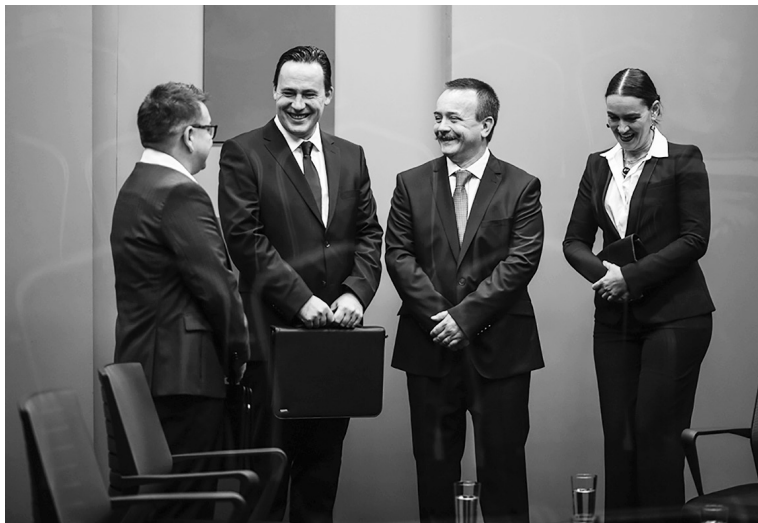
Jelenet A Grönholm-módszerről . Humora az abszurdításában rejlik