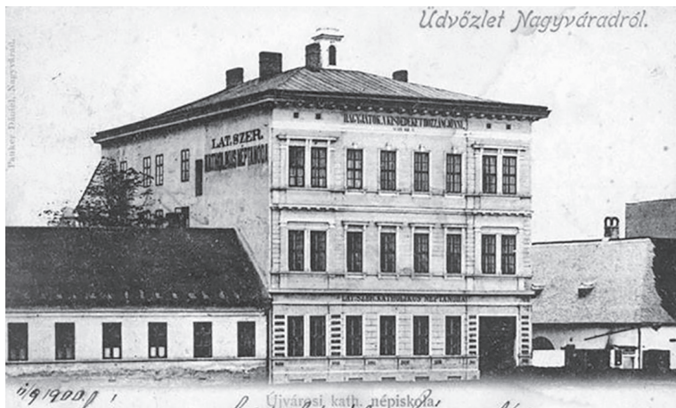
A Dudek-iskola jó száz év előtti képe