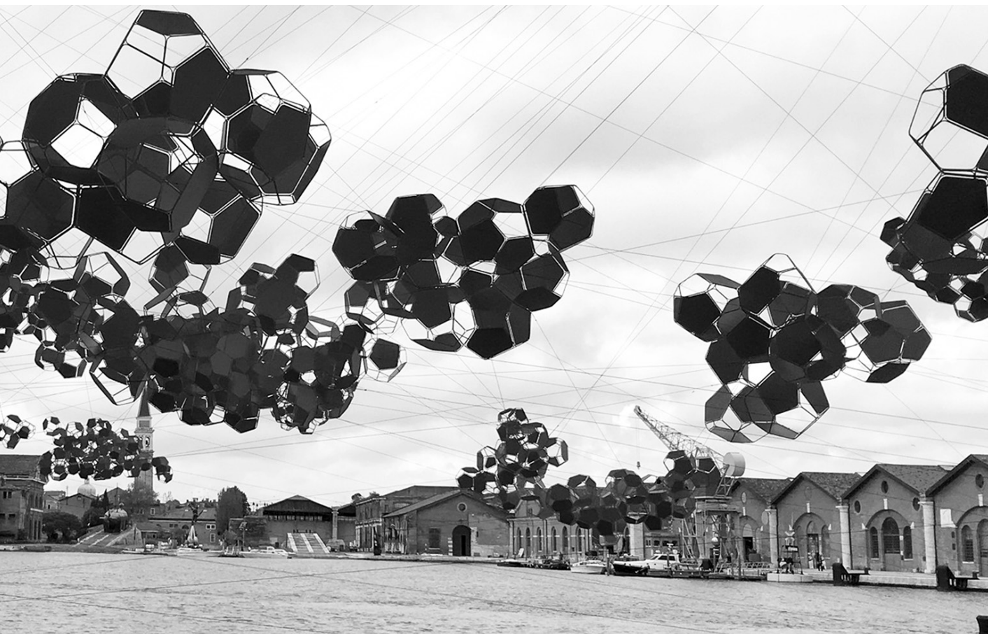
Tomás Saraceno: Aero(s)cene: When breath becomes air, when atmospheres become the movement for a post fossil fuel era against carbon-capitalist clouds, 2019