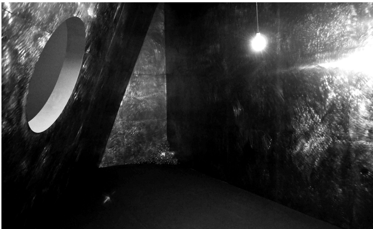
Apichatpong Weerasethakul & Tsuyoshi Hisakado: Synchronicity, 2018, egysatornás videó, hang, izzó, projektor, redőny, mikrofon, alumínium