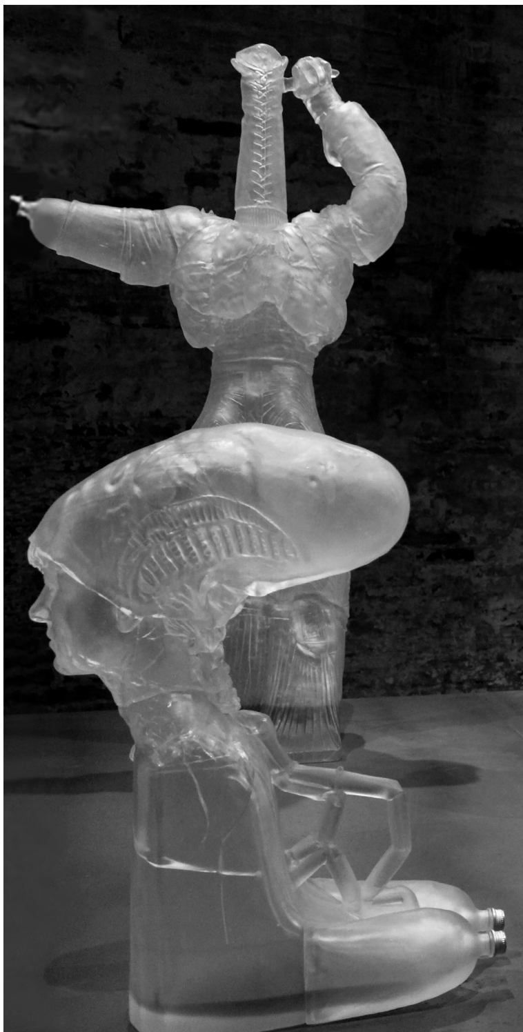
Andra Ursuța: Impersonal Growth / I Don't Feel at Home in the World Anymore, 2019, kristályüveg, alumíniumkupak, alkohol, különböző méret