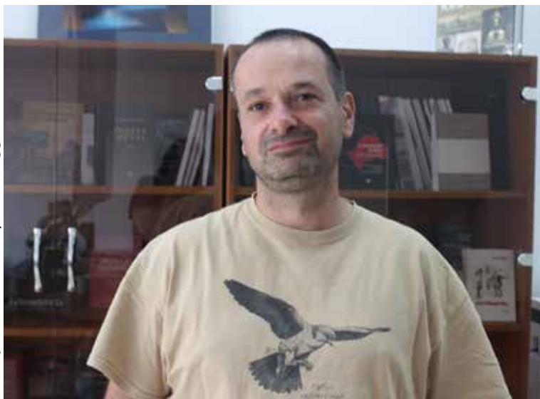
A fotókat és térképeket Nagy Attila készítette

„A mezei pacsirta ( Alauda Arvensis ) rovarévo madár, a talajon fészkel, alacsony fűű élőhelyen, és sikerült alkalmazkodnia a megváltozott életkörülményekhez, mindenféle növényi kultúrában ott van, csak hogy ez számára bizonyos fokú ökológiai csapda, a mezőgazdasági munkák kedvezőtlen módon befolyásolhatják a költési sikert. A ragadozó madarak vadásznak rá, és a természetes rendszeren kívül a kóbor macskák; földön fészkelő madárról van szó, a tojásokat is és a fiókákat is erősen megdézsmálhatják. Az Egyesült Álla-