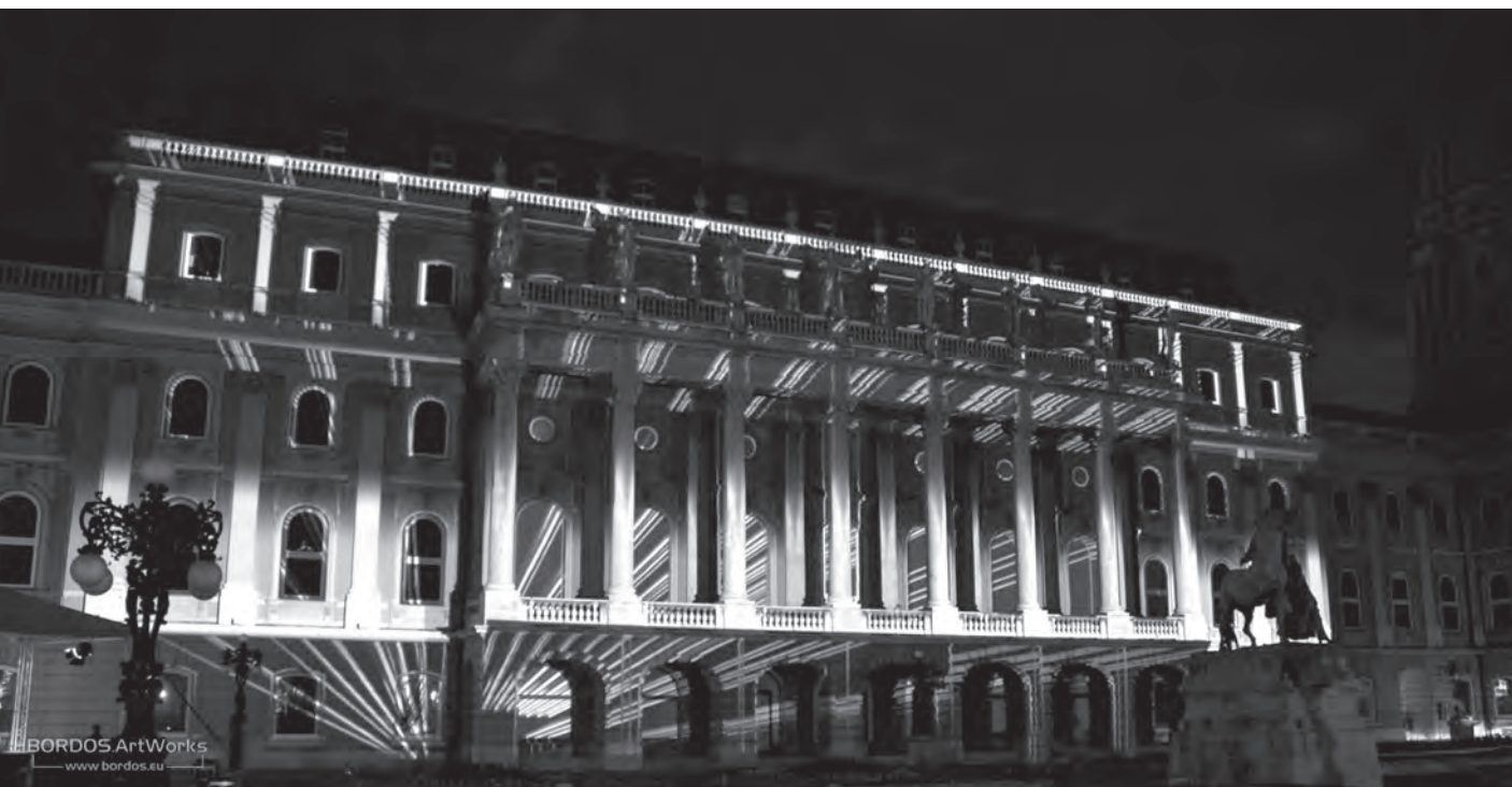
BudaCastle Budapest

Épületvetítéseivel 4 , majd panoráma-vetítéseivel eljutott Los Angeles-től New Yorkig, Dubajtól Párizsig, Genftől Kölnig, Sanghajtól Moszkváig. Romániában is láthatók voltak épületvetítése a Temesváron, Marosvásárhelyen és Kolozsváron. Bordos nevéhez fűződik a világ első sztereoszkopikus épületvetítése, ezt Genfben 2012-ben láthatták a Mapping Fesztivál résztvevői. Ugyancsak az ő nevéhez köthető Európa első állandó kültéri épületvetítése, a lökösházi Bréda-kastély fala-