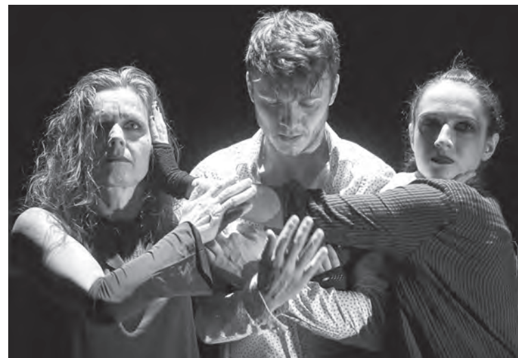
A tavasz ébredése

tartozó teátrumról is, amelynek társulata még nem volt Váradon, sőt az egész Partiumban és Erdélyben rég fordultak meg. Szívesen fogadták a meghívásunkat, és sokat dolgoztak azon, hogy a mi színpadunkra adaptálják előadásukat.