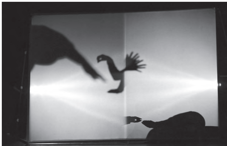
A Boldog Herceg a világirodalom egyik legszebb meséje