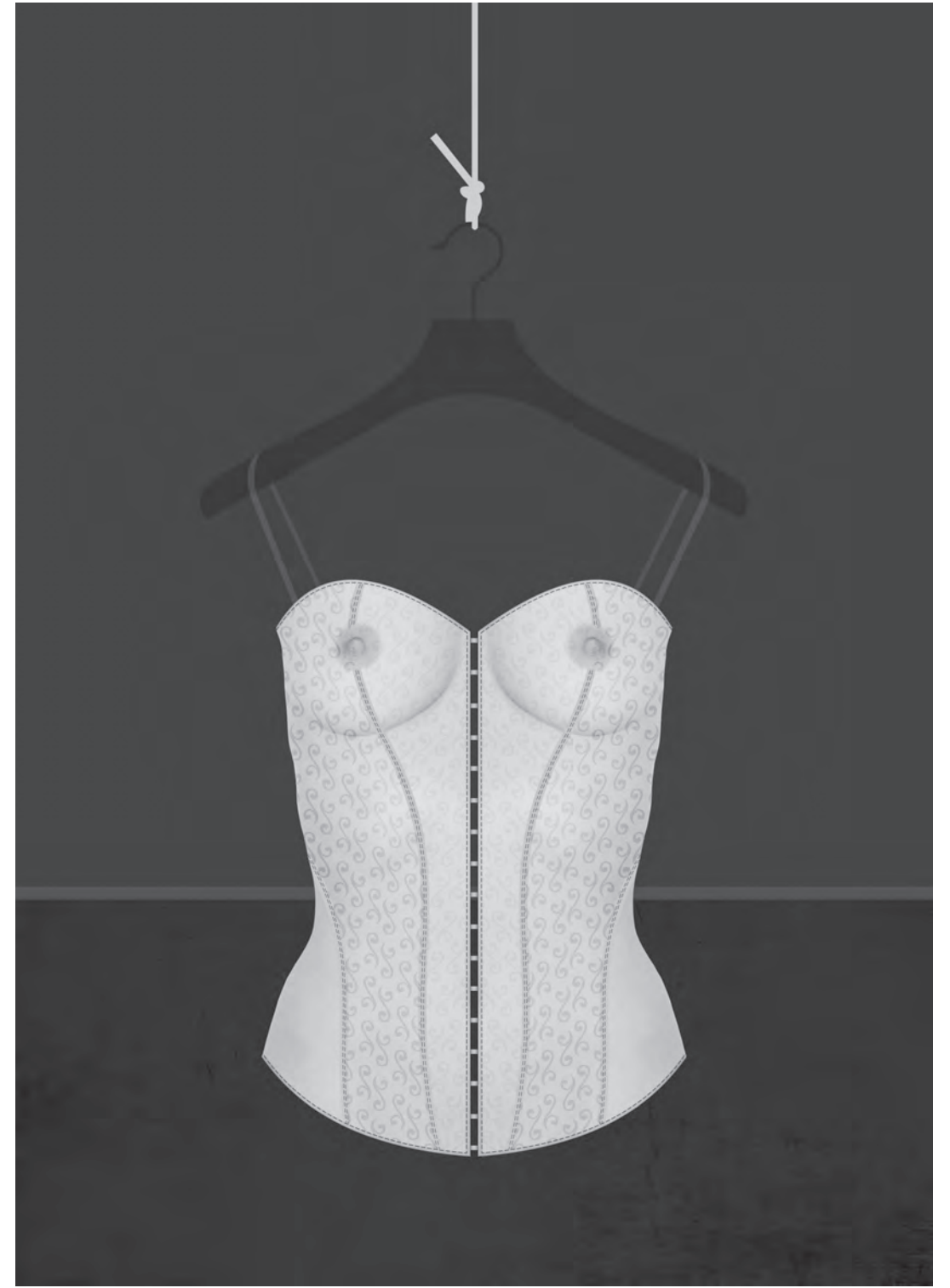
Not For Sale!, 2014