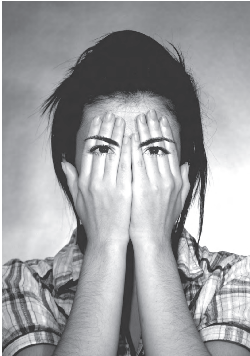
Now You See Me, 2009