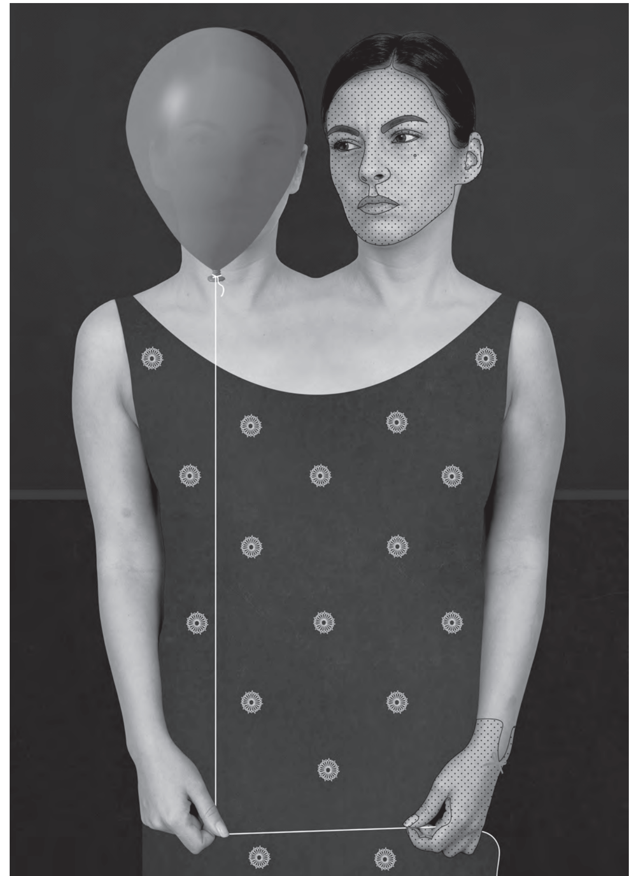
Festive Snapshot, 2017