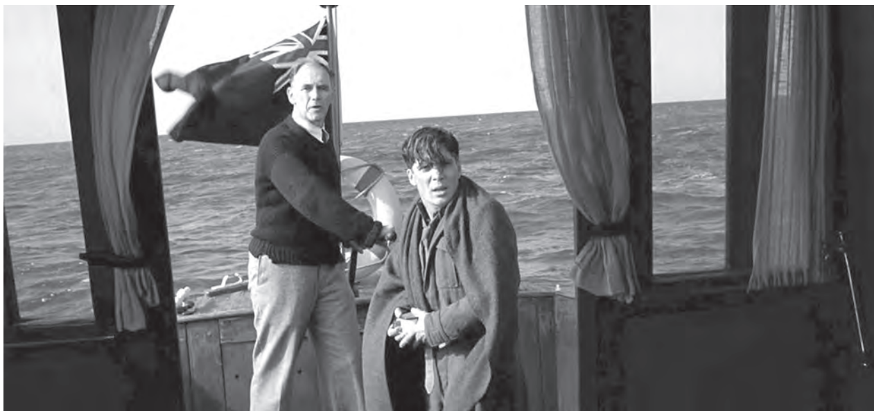
Érkezik a segítség. Mark Rylance és Cillian Murphy

Ezen a ponton szoktam kitérni a film szereplőire, de ezúttal a szokásosnál nehezebb dolgom van. A Dunkirknek ugyanis nincs a hagyományos értelemben vett főszereplője, inkább csak olyan tükörszereplők vannak, akiken keresztül az események különböző síkjaiba bepillantást nyerhet a néző. Itt senkinek nincs tragikus múltja vagy egyéb háttértörténete, és nincs is szükség különösebb motivációra ahhoz, hogy azt tegyék,