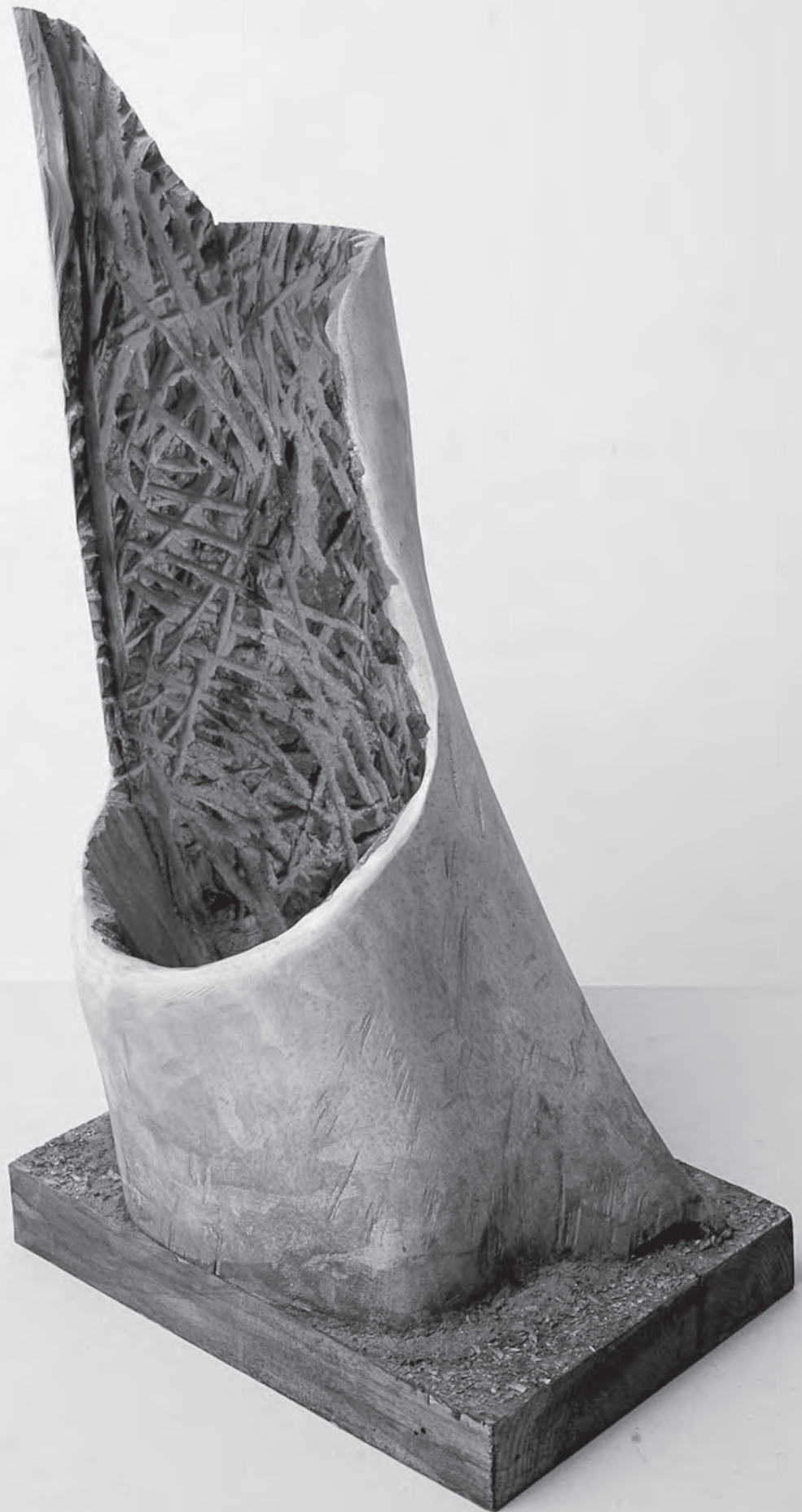
Iszony II., 2015, fű, 71×50×27 cm