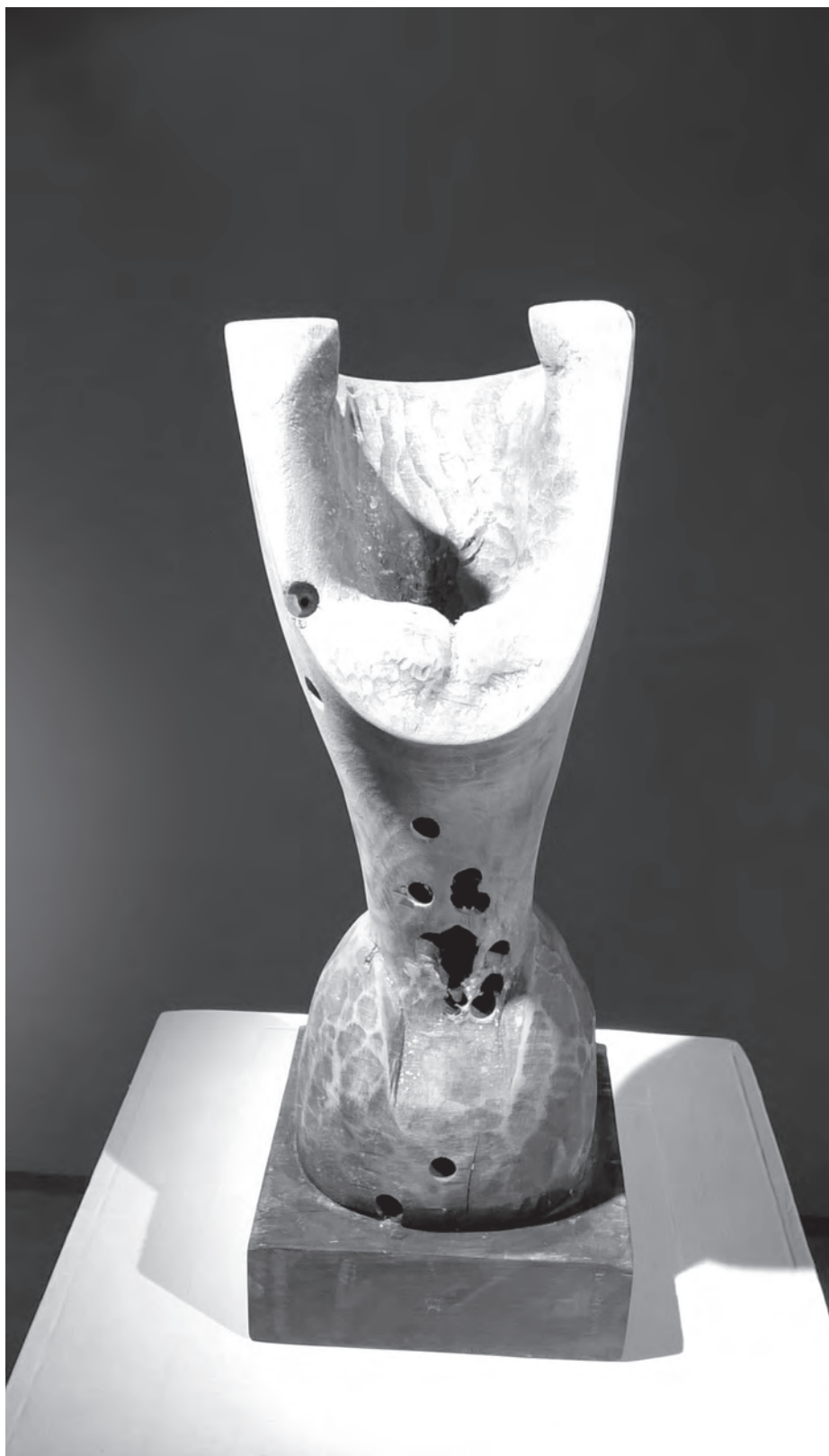
Mártír, 2015, fa, 35×15×15 cm