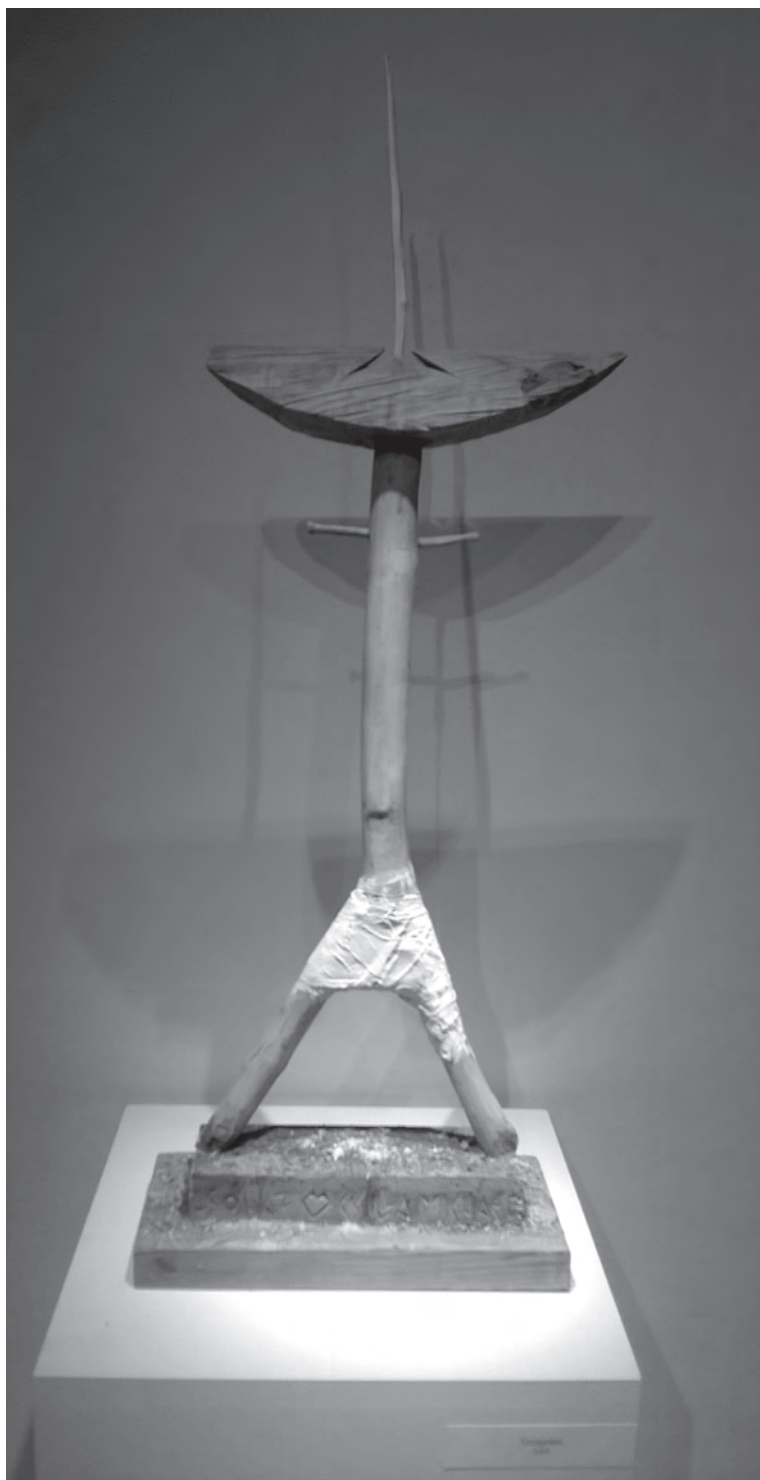
Emigráns, 2005, fa, fásli, 75×30×12 cm