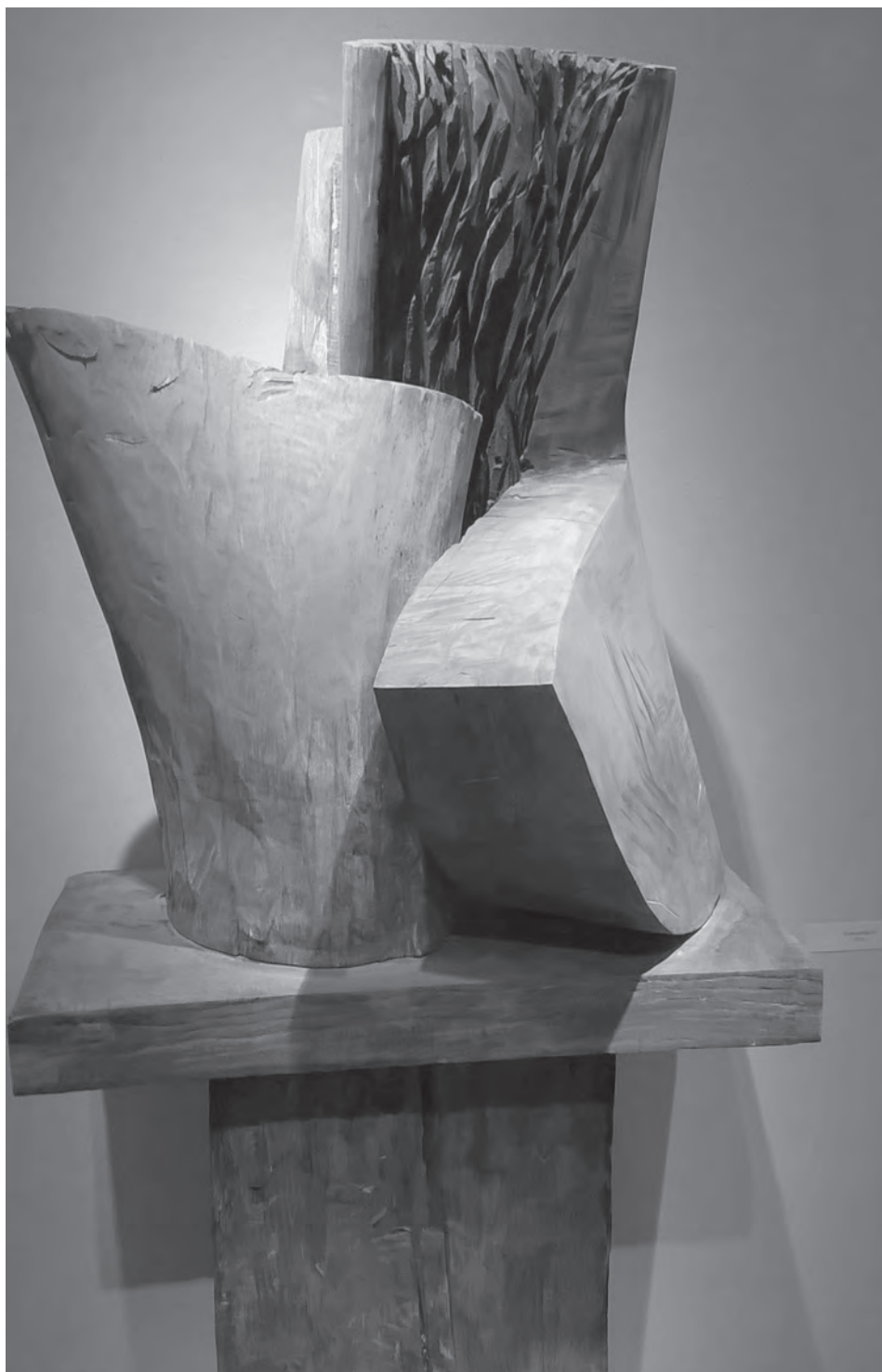
Fej 2, 2000, fa, 70×40×35 cm