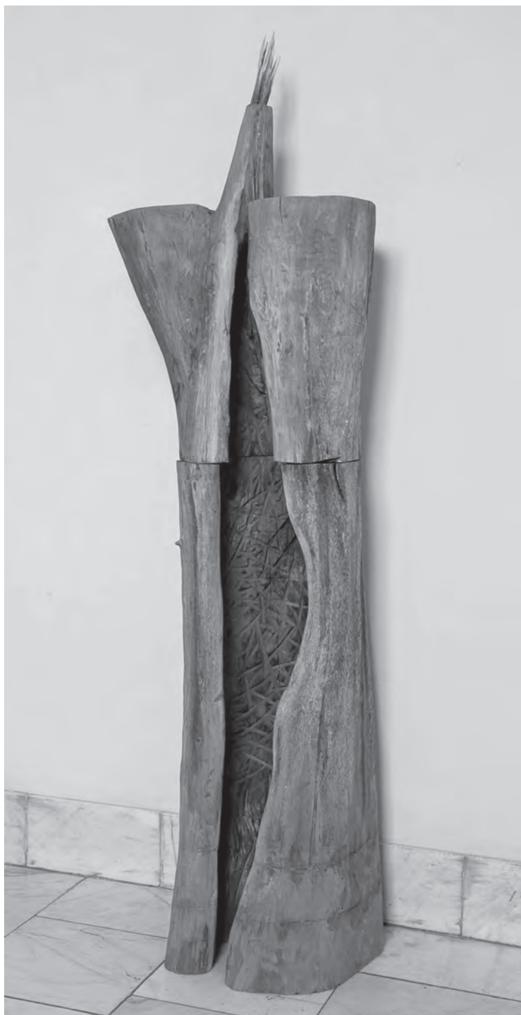
Üreges bálvány, 2015, fa, 180×90×50 cm

kell modern művésznak lenni, hogy érződjön az alkotásokban, honnan jön a művész”. Meg hogy „nekem itthon, Erdélyben kell művésznak lennem, és a székelységet, erdélyiséget a tőlem telhető legkor-szerűbb formában szabad, érdemes plasztikában megfogalmaznom”. A térbeliség ígézetében élő szobrász bevallása szerint „nem én diktálok a fának, a fa diktál a művésznak, inspirálják az üregek, a görcsök, a hasadások. Szeretem beszélgetni a fát, nem erőltetem rá a témát, továbbfejleszttem, ami benne rejlik”. Gyakran készít finoman csiszolt kisplasztikákat, amelyeknek a teljes felületét gyöngéden megmunkálja, valósággal megszelídíti ( Fantomok, Menedék, 2016 ), máskor meghagyva a fa kérgét, felhasználva annak természetes szépségét, ráfest, rárajzol ( Tragikus maszk ). Egyik, nemzetközileg, Japánban is nagy elismerést nyert, illesztett fából készült sorozata, a Levélkürt , finom faragás és aprólékos csiszolás eredménye. Erre a sorozatára, akár több, más munkájára ( Arc, 2007; Ima 1, 2015 ) jellemző, hogy a külső felületek letisztultságát a belső terek, az „odvak” durvább megmunkálásával, elnagyolt kivá-jásával társítja; hol finom kivitelezéssel, hol nyers kiviséssel – akár mind a kettővel egyszerre – artikulálja plasztikai üzenetét, olykor az üreges részek élénkebb színezésével társítva. ( Erupció, 2007 ) A „véletlen” egyáltalán nem elhanyagolandó eszköze Vargának, de a struktúrák tudatos felépítését gyakorta racionálisan leegyszerűsített gör-