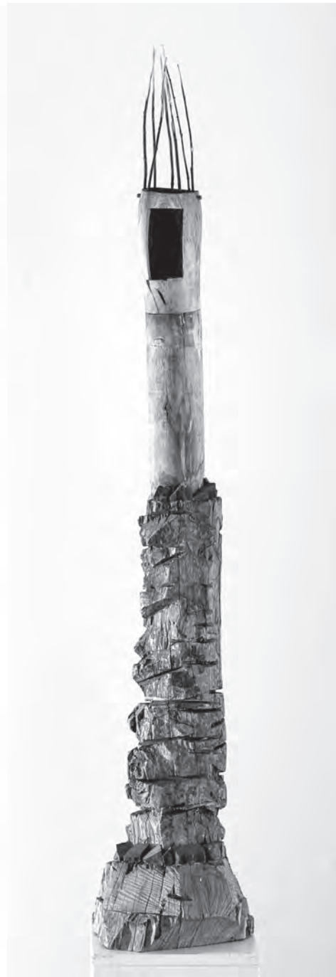
Lidérc, 2015, fa, 163×36×25 cm