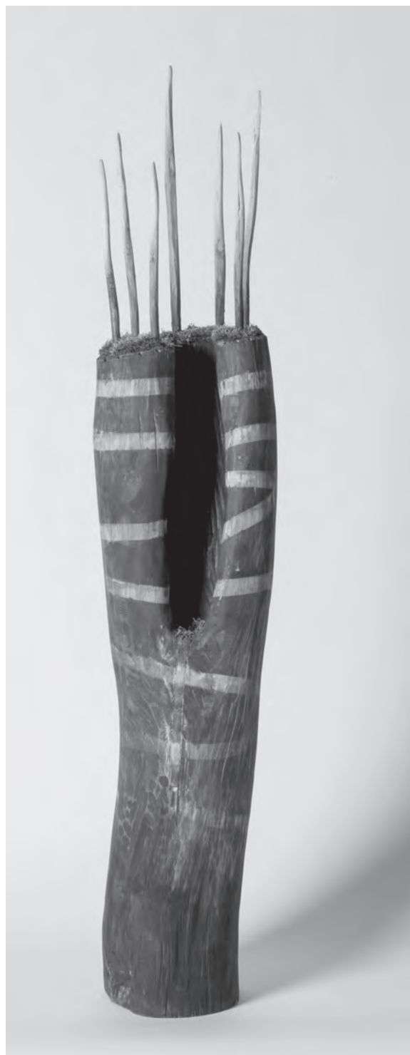
Vidám indián, 2014, fa, 110×25×25 cm