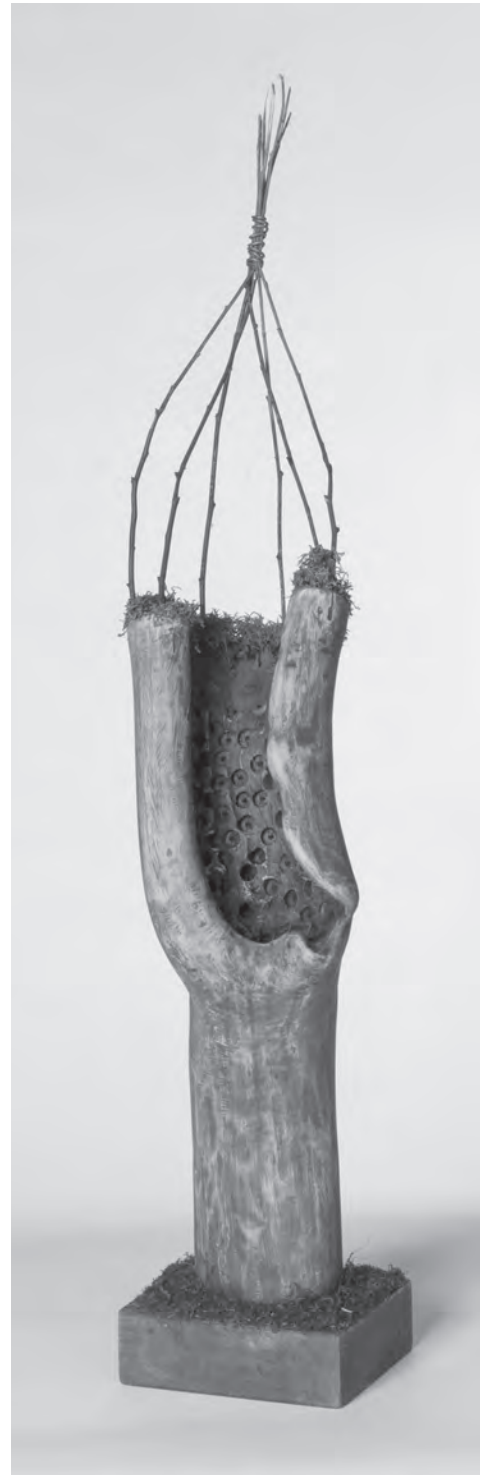
Arc , 2007, fa, 43×15×10 cm

De hadd térjünk vissza Vargha Mihály fából készült kisplasztikáira, melyekkel folyóiratunk, a Várad májusi számát illusztráljuk. 2016-ban, budapesti kiállítása alkalmával nyilatkozta, Kós Károly örökségét vállalva, hogy „úgy