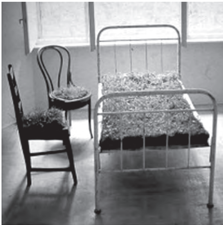
In memoriam Baász Imre, 1994, fém, fa, gyep, 80×200×200 cm

A kőmúltú, bronzjelenű szobrásznak saját bevallása szerint mégiscsak a fa a legszeretettebb anyaga. A művész preferenciája érthető és sokszorosan indokolt, hiszen a fa minden egyéb matériánál nagyobb lehetőséget, szabadságot kínál az absztrakcióra és a figuratív megnyilvánulásokra, a szellem anyagba örökítésére és az anyag spirituálissá formálására. A természet – ez a primer alkotótárs – előmódolja a művész keze és alkotókedve ügyébe kerülő faanyagot, natúra anyánk az általa térben felkínált plasztikum fokozására vagy redukciójára ihleti az alkotót.