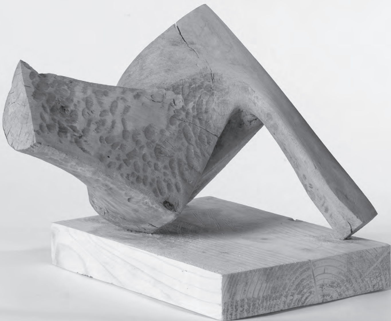
Menedék, 2016, fa, 35×25×20 cm