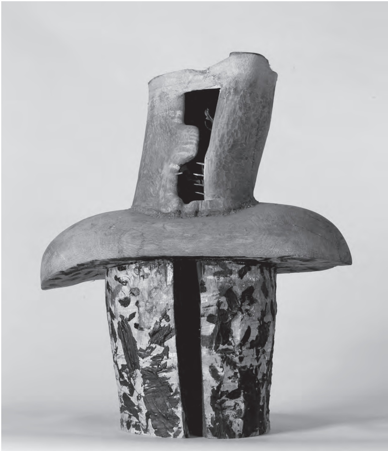
Tragikus maszk, 1992, fa, fásli, falevél, 60×48×25 cm