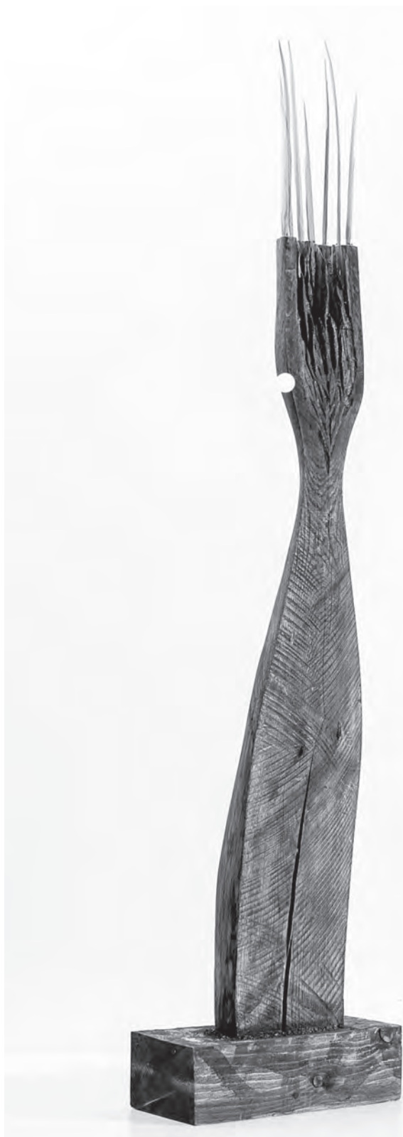
Mancs, 2014, fa, 120×16×10 cm