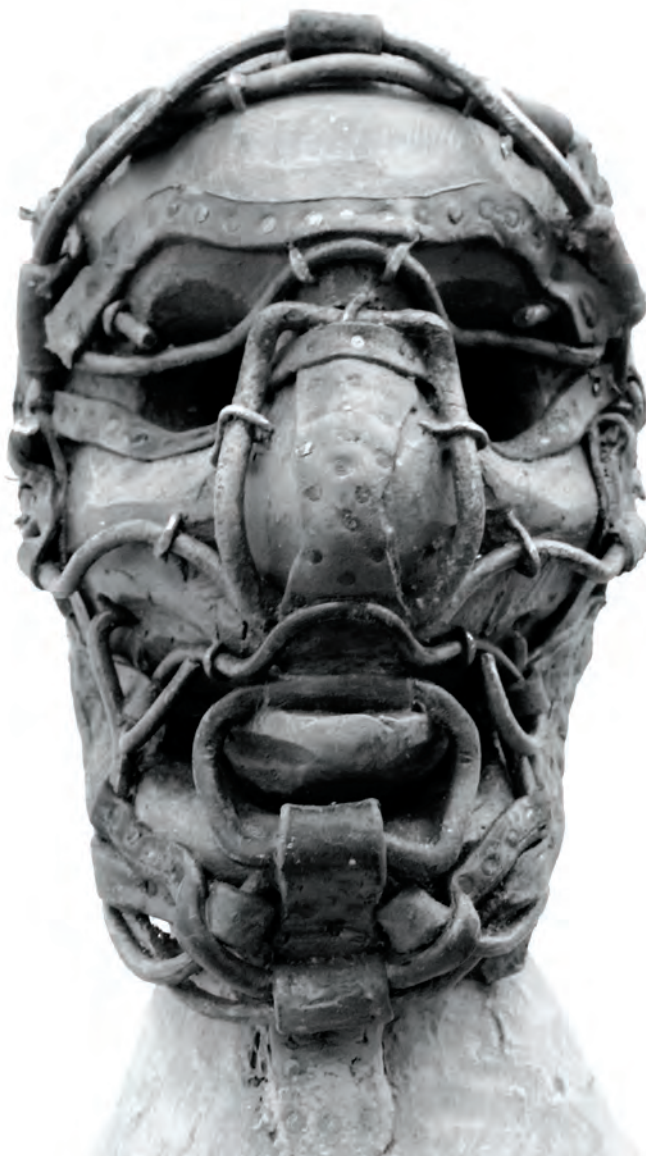
Transhuman Fetish III., 2012, fa, bőr, vas, 48 × 32 × 22 cm

De ő nem nekem válaszol. A Persona sajtó lelkében, valahol nagyon a természet-valóság mögött egy lóhosszal, ott ücsörög az igazság. Azt mondja a Persona: – Folyton megbök az igazság, nyomogat meg szólongat, aszondja: nem úgy van ám, ahogy mondd.