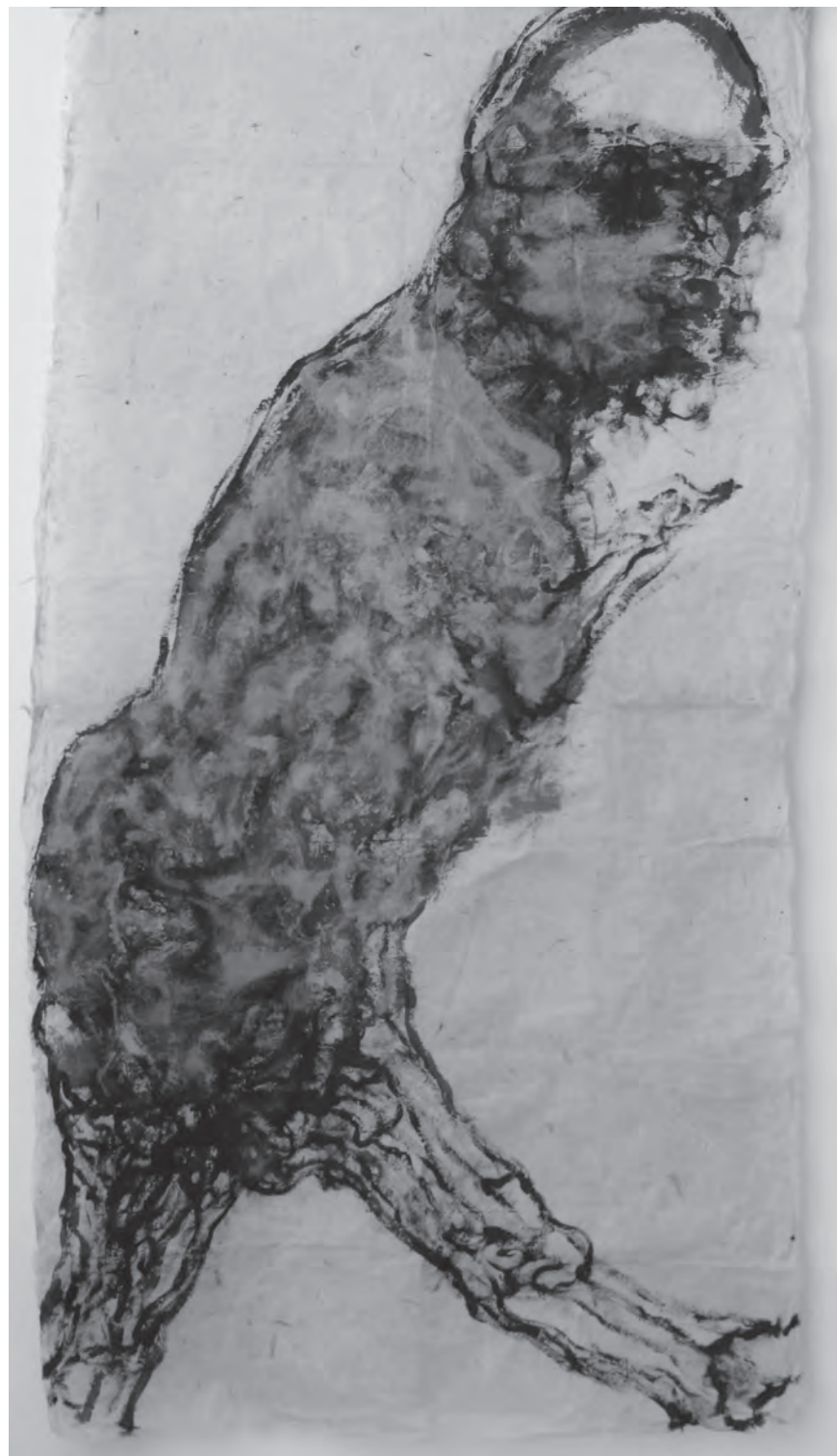
Persona Umbra, Corpo III., 2016, akril, rizspapír, 170 × 90 cm

latában. Csillapíthatatlan szédülésben igyekszik megkerülni a földet, aztán minden csillagot és bolygót az Univerzumban.