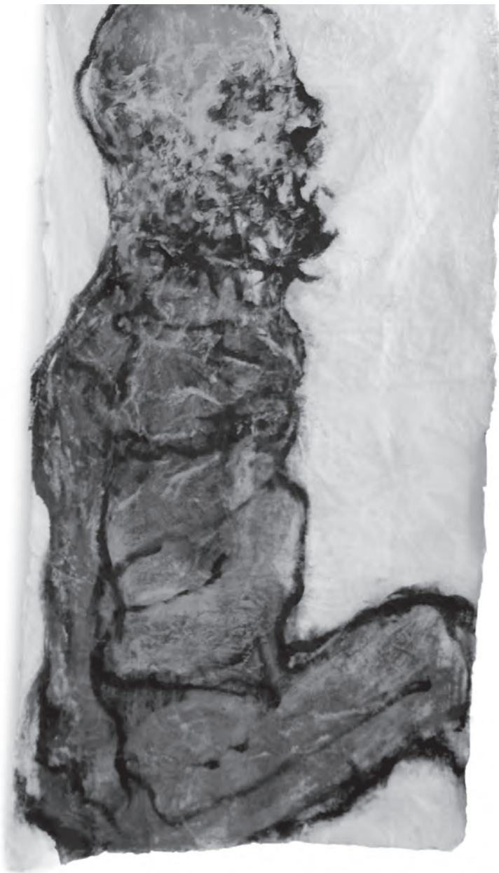
Persona Umbra, Corpo II., 2016, akril, rizspapír, 170 × 90 cm

Nem fél megragadni az igazságot, szembesíteni a valósággal, feltenni a kérdést, hogy miért lehetséges az, hogy minden valódi dolog csak akkor valódi, ha egyfajta tudatformában