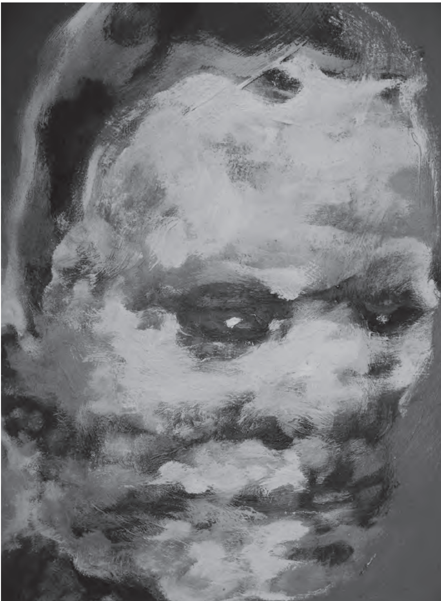
Persona Umbra, Arc II., 2016, akril, rizspapír, 105 × 90 cm

Igaza lehet. Nehéz szeretnem az igazságot. Hát akkor kérdezek én is a Persona Umbrától: – Nem értem, hogy miként lehetne, vagy kell-e az Élet megismerése által eljutni bárhová is.