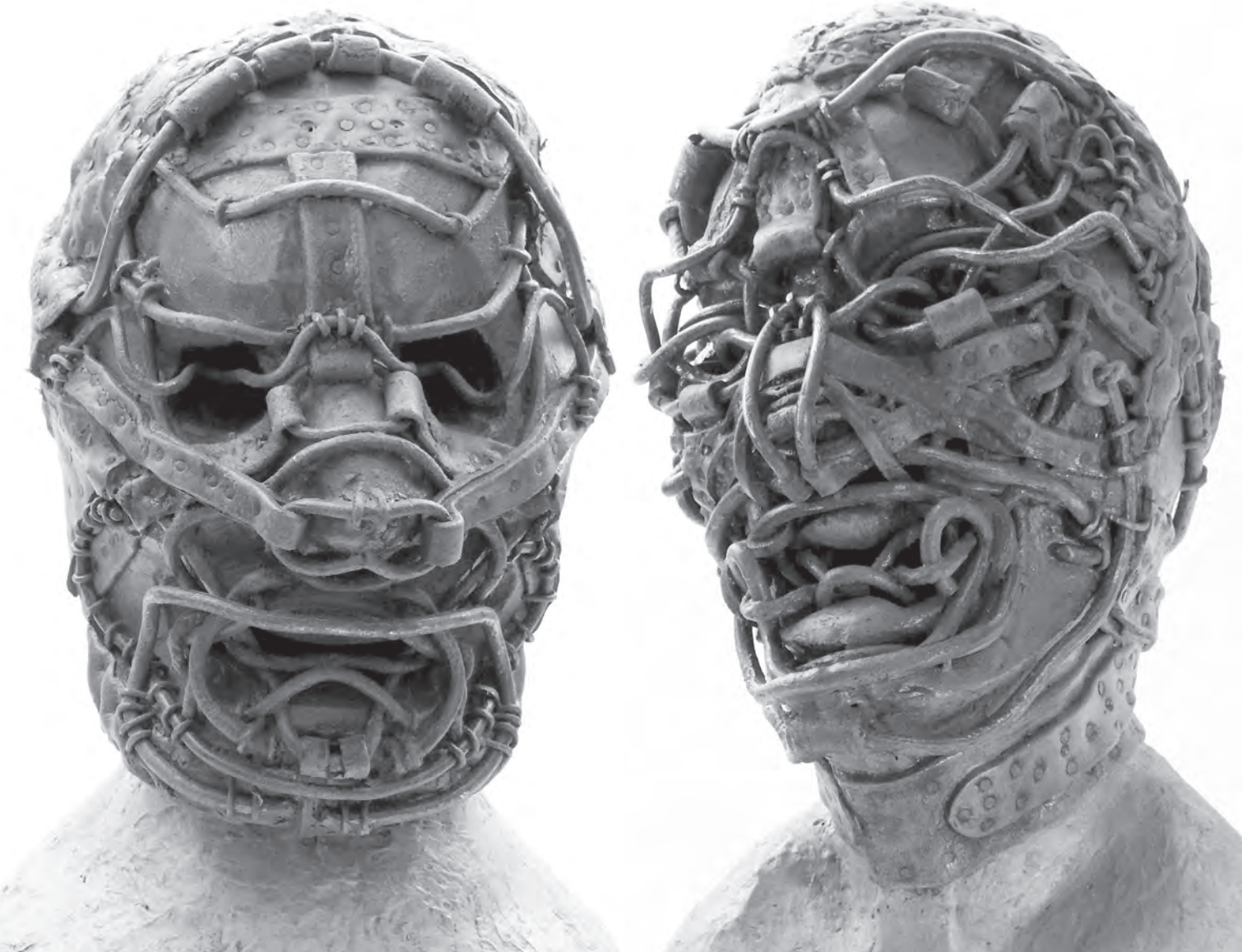
Transhuman Fetish VII., 2012, fa, bőr, vas, 43 × 29 × 27 cm

sában öltének testet sosem volt alakjai, amelyek sem hittel, sem szeretettel nem formálhatóak valódivá. Hacsak nincs egy grafikus – szobrász és festő, egy hangosan dűnnyögő performer, aki képes a művészet nyelvén új hangon szólni, építve egy új