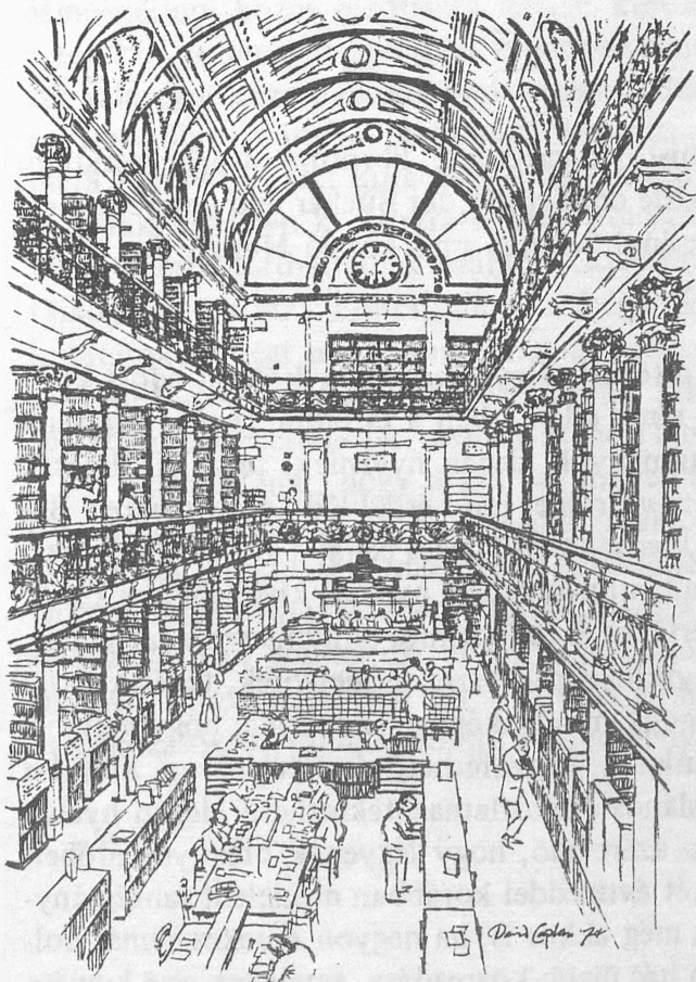
A természettudományi kézikönyvtár olvasó terme Holbornban

lényegesen bővebb beszámolókat imponálóan egészíti ki az a jegyzék, amely a könyvtár tárgyévi publikációs tevékenységét mutatja be.