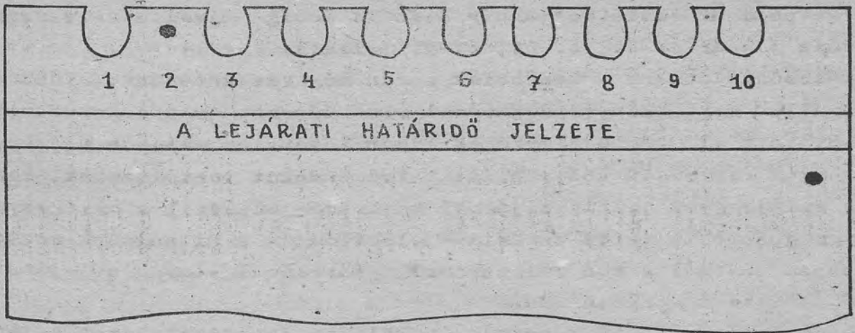
Kölcsönzőlap a lejáratí határidő jelzetével.