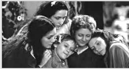
A kép forrása a Kisasszonyok filmadaptáció (1994)

Ralph Waldo Emerson az esszéiben, valamint a híres emberekről szóló portréiban, illetve Henry David Thoreau a hosszabb-rövidebb lélegzetű írásaiban a filozófia tudománya felől közelítve fejtették ki a transzcendentizmus értékrendjét. Louisa May Alcott viszont az ifjúsági és a felnőtt irodalom keretei közé ágyazta a fentebb felsorolt ideákat. Leghíresebb művei a Kisasszonyok ( Little Women ) és a folytatása, a Jó feleségek ( Good Wives ) négy lánytestvér és az ő közösségüket központilag összetartó édesanyjuk életén keresztül mutatta meg a transzcendentizmus életideálját, külön kitérve a női sorsok lehetséges alakulására.