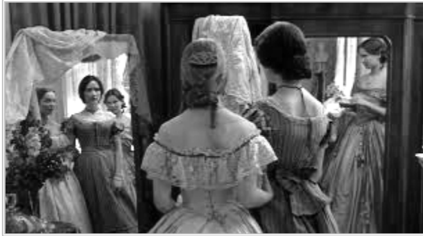
A kép forrása a Kisasszonyok filmadaptáció (1994)

Tanulságos a két regényben a March család és az őket körülvevő gazdag emberek világnézetének különbségeit megfigyelni. March-ék is előkelő famíliának számítanak, ám elszegényedtek, azonban a bálókra, rendezvényekre hivatalosak. Viszont sokkal haladóbb nézeteket képviselnek, mint a többiek. A lányok édesanyjának nem elsődleges célja férjhez adni a gyermekeit, hanem igyekszik abban segíteni őket, hogy azzá váljanak, akik szeretnének lenni. Meget, ahogy már utaltunk rá, egy rövid időre magával ragadja a bálók csillogó világa, ám hamarosan visszatalál eredeti önmagához és a valódi értékrendjéhez. Jo-t már eleve nem érdeklik az ilyen ünnepek, de nővére miatt elmegy egyszer. Viszont tudatosan nem illeszkedik be, hanem inkább egy külön teremben táncol Laurie-val. Beth visszahúzódo természete miatt soha nem megy bálba, Amy azonban igazi társasági hölgygé neveli ki magát, aki a modorával eléri azt is, hogy Jo helyett őt vigye a nagynénjük Európába, majd a Jo által megsebzett szívű Laurie-t veszi pártfogásába, míg végül egybekelnek, lányok születik, és élnek a gazdag, haladó