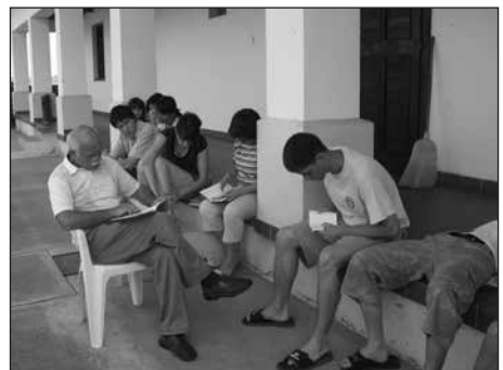
Képek a későbbi Ratkó József Olvasótáborokból (A bal felső fotó 2006-ban, a többi 2007-ben készült.)