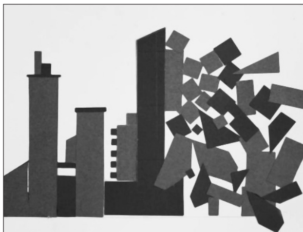
Nonfiguratív kompozíció Szecskó Mihály, AKG