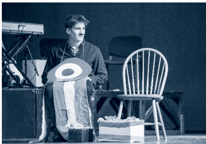
Jelenetek a Pesti Magyar Színiakadémia március 15-i ünnepi előadásából

Szomorú epilógusként teszem fel a kérdést: és miránk mi vár, boldogtalan 21. századiak?