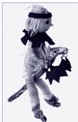
Alkotónap – Pünködsi király – pályamunka

Az irodalmi forrás, a néprajzi közeg és a képzőművészeti technika találkozása az Alkotónap. A művészeti nevelés legjobb módja maga az alkotás, a cselekvés.