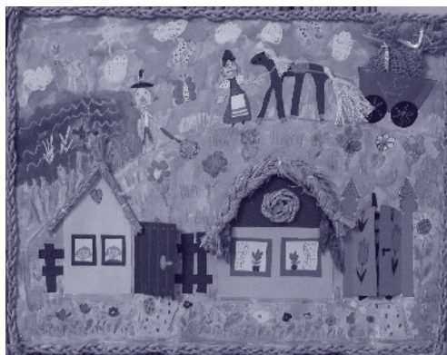
Alkotónap – gyermekfestmény

Az irodalmi forrás, a néprajzi közeg és a képzőművészeti technika találkozása az Alkotónap. A művészeti nevelés legjobb módja maga az alkotás, a cselekvés.