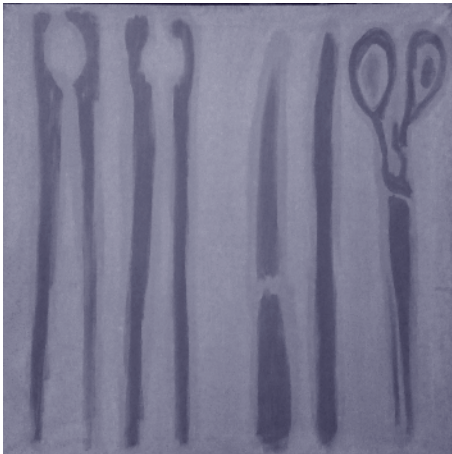
Barta Kristóf 2 csipesz, 2 kés, 1 olló olaj, vászon 98x98 cm

Szecska Károly műve rendkívül jelentős abban a vonatkozásban, hogy egy nagy formátumú tudós tanár teljes életútjáról és munkásságáról olvashatunk tudományos igényű feldolgozást. Ugyanakkor személyén keresztül képet kaphatunk arról, hogy egy 20. századi értelmiségi pálya mennyi nehézséget és buktatót tartalmazhatott, különösen, ha valaki közéleti szerepet is vállalt.