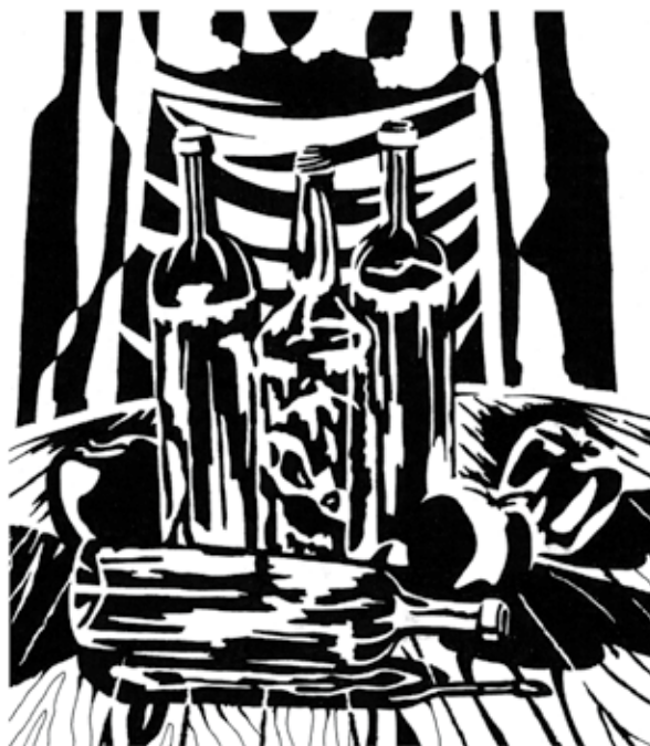
Hajba László: Csendélet (ceruzarajz, tus, filctoll)

Az összetett beállítást több fázison keresztül redukálva, felismerhetővé válnak a formák, a térbeli viszonylatok, a fény-árnyék hatások és a textúrák lényeges vizuális jellemzői. Ez a feladattípus előkészítése az elvont alakzatokkal történő szabad komponálási gyakorlatoknak, a képi-téri jelekben való gondolkodásnak.