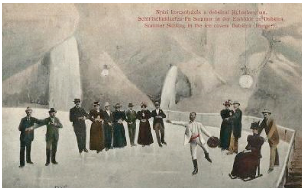
Korcsolyázás a Dobsinai-barlangban korabeli képeslapon