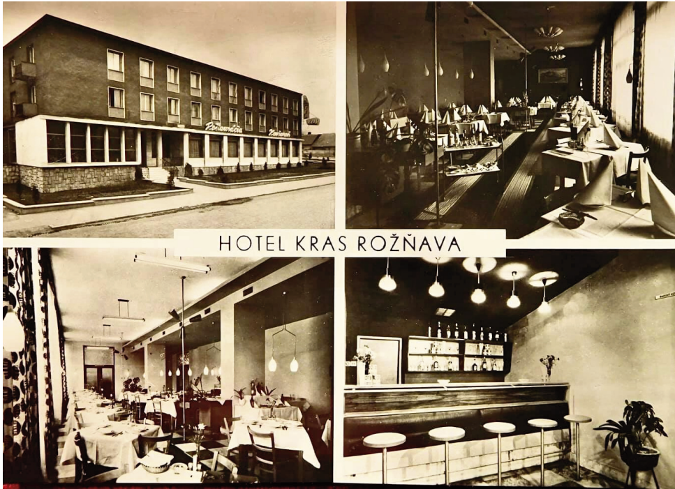
8. kép. A Kras Szálloda megépülését követően (Képeslap, forrás: internet)

Beszélték, hogy vót lövődözés, én is halotam. Az oroszok lövődöztek a Krasba, de a kis Krasba. Ez ot van ódalt, de most már máskép van ot, mind akor [...] vótak lyukak a falba, amit a golyók csináltak. Azt hiték, őket lövik valakik, oszt tele let a gatya, ijetükbe tüzeltek mindenfele. Valakit talán oszt meg is halt. De lehet az is, hogy csak megsebesültek. Rozsnyai fiúk vótak. winnetous filmet vetítetek a moziba épen, oszt aba a filmbe lőtek, őket nem lőte senki se [...] De a ruszkik eztet nem tuták. A mozi fele meg mindenfele repültek a golyók, szanaszét [...]