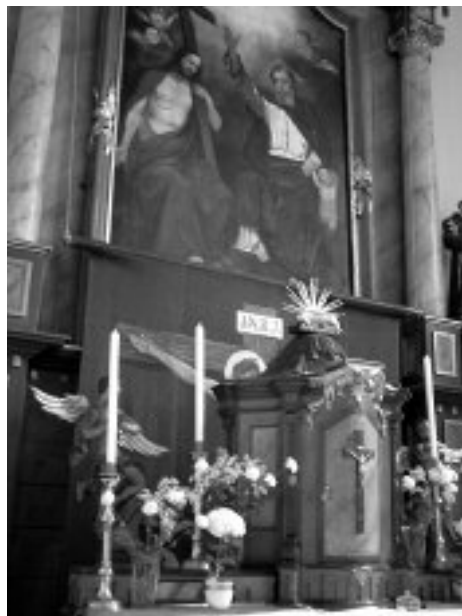
A nagyböjti oltárkép – az oltáron és miközben leengedik.