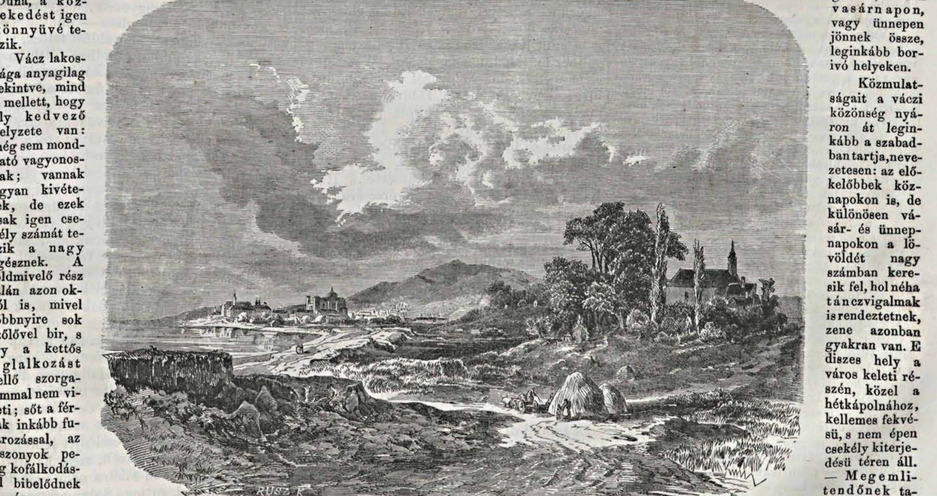
Vác város látképe. — (Keleti Gusztáv rajza.)

voltak, jól megragatták a tapasztalatlan utasokat; egy pár év óta azonban rendes árszabály alá vonattak, s hogy egymást ne rongálják, a fuvar kiállításra sor szerint törtenik; mire nézve a felügyelés egy általuk megválasztott fuvar-biztosra van ruházva. A nagy számu talpigások most már nem szamarakat — mint ezelőtt — hanem többnyire jó lovakat tartanak. nem létezvén, vizet távolabb helyről kellett a szükségletezhez képest hordatni, — mit látva a jótékony tetteiben kifogyhatatlan néhai Gáspár Kázmér n. prépost, egy kutat igen díszes alakban készíttetett el; a lövészeget pedig hálaemlékeül e tettét egy kut közelében befallazott márványban örökté meg. — Az 1848-1 forradalom alatt, az itt keresztülvonuló oroszok