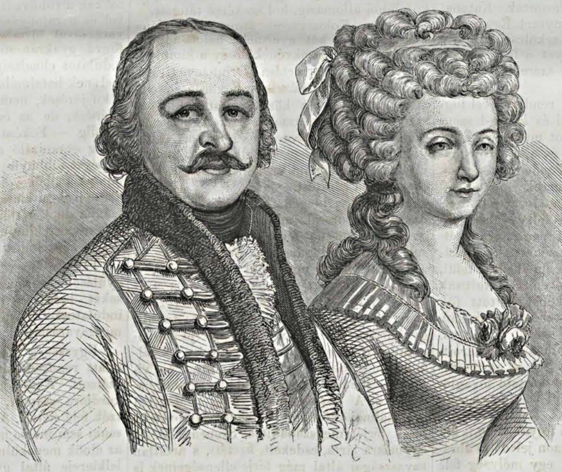
Id. báró WESSELÉNYI MIKLÓS ÉS CSEREI HELÉNA. (Egykoru olajfestmények után.)

Id. báró Wesselényi Miklós és Cserei Heléna. Élete zajos és sokszor elborult pályáján jótékony mentőként örkődék mellette a hű nő Cserei Heléna, szelid lelke, a gyöngédség, türelem és női eszély mintaképe, s eszményi ellentéte az aczell jellemű, de önfegyelem nélküli férfinak. Olvasóink bizonyosan szívesen fognak követni, ha ez eseményekben dus kettős életpályá változatos mozzanatainak szemléletére hívjuk meg. Báró Wesselényi Miklós 1750. decz. 11-én Zsibón született. Alig volt nyolcz esz-