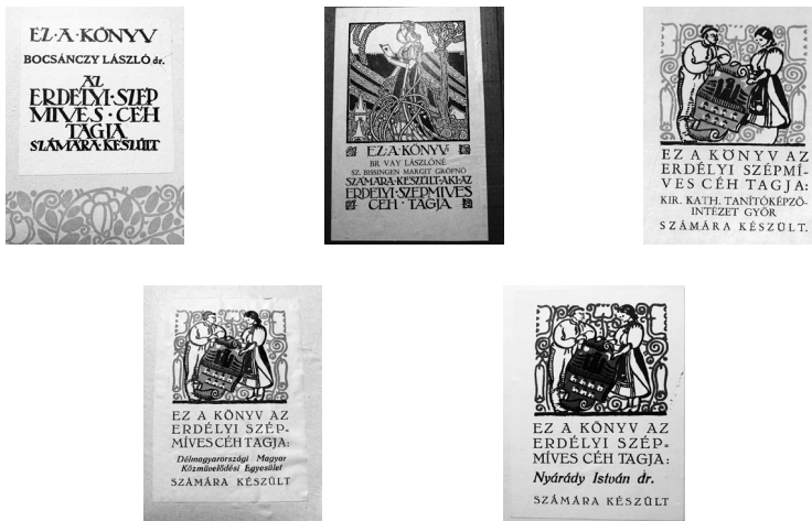
1. ábra. Az ESZC ex librisei

Az ESZC három különböző típusú ex librist tervezett amatőr könyveihez. (1. ábra). Az első két sorozatban egyszerű, kisméretű fehér 9×9, majd 6,5×6,5 cm-es lapon olvasható a pártolótag neve. A III. sorozat ex librisét Debreczeni László (1903–1986) grafikusművész szép szecessziós rajza díszíti. Méreténél fogva (16×10 cm) kisgrafikának is tekinthető. A IV. sorozattól Kós Károly kétalakos, színes ex librise került a könyvekbe. Színe kezdetben okkersárga, a VIII. sorozattól kék színű. A pártolótag nevét rányomtatták az ex librisre, de néhány esetben írógéppel készült, elsősorban az ajándékba adott, tagsággal nem rendelkezők számára.