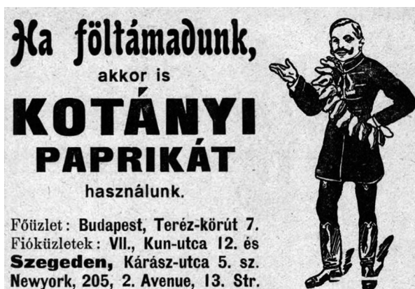
8. ábra. Borsszem Jankó, 1915. április 4., 13.

Az 1915. április 4-i, húsvét vasárnapi szám első oldalának felkiáltására reflektál a hirdetés szövege (9. ábra). 75 A címlapra jón jól kivethető a PAX felirat – a fiatal nőként megszemélyesítve ábrázolt béke koporsóban nyugszik, amelyre egy vitéz vgyáz. Az üvegkoporsó itt lényegében mint ereklyetartó jelenik meg,