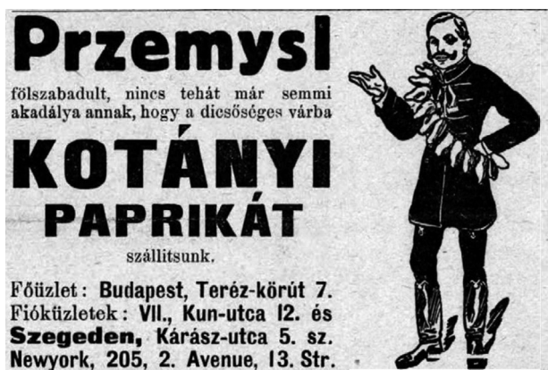
5. ábra. Borsszem Jankó, 1914. október 25., 11.

A marne-i csata napjaiban, azzal mintegy párhuzamosan hatalmas méretű harc folyt a keleti hadszíntéren, Galíciában is. 60 Az Osztrák–Magyar Monarchia a 19. század közepétől kezdve az első világháborúig Przemysl körül 45 kilométer hosszan erődítménykomplexumot épített az Orosz Birodalom katonai fenyegetéstől tartva. 61