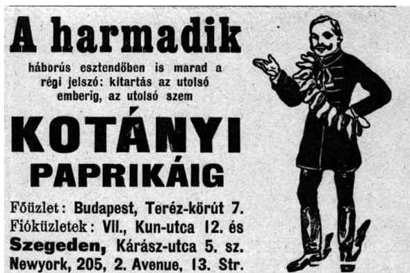
11. ábra. Borsszem Jankó, 1916. augusztus 6., 13.

A harmadik háborús évre már egyre nőtt az elégedetlenség és kiábrándultság a harcoló katonákban és az otthon maradtak táborában egyaránt. Az egyéni lelkesedés megkopott, de a háborús propaganda töretlenül igyekezett azt életben tartani. Ehhez kapcsolódik az általam vizsgált utolsó hirdetés 1916-ból (11. ábra), amelyben az utolsó ember ugyanolyan fontos, mint az utolsó szem paprika. A hirdetés többféle módon is értelmezhető. Egyrészt dekódolható mint a végsőkig való kitarásra buzdítás (véltetőleg ez volt a hirdető szándéka), másrészt viszont az „utolsó ember” és az „utolsó szem paprika” azonos szintre helyezése az emberélet értékének leszállítását jelentette. 83