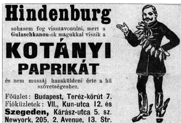
6. ábra. Borsszem Jankó, 1915. január 10., 11.

A háború második évében a reklámok visszatérő eleme a békekötés teljes mértékű elutasítása; erre reflektál a január 10-ei hirdetés (6. ábra), 66 miszerint az új mozgókonyha hadba állítása miatt nincs szükség visszavonulásra. A hirdetés megemlíti a magyarokat, mint Hindenburg és az osztrákok hű szövetségeseit.