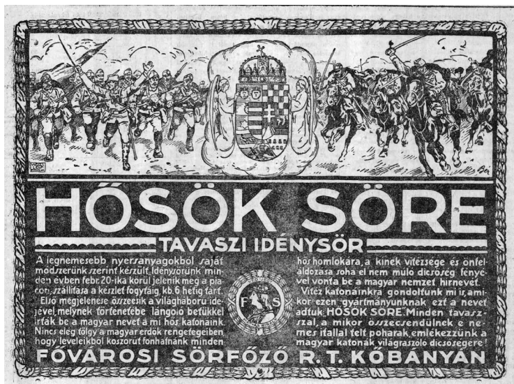
1. ábra. Hősök söre (Pesti Napló, 1915. február 26., 14.)

szellem.) 48 Ugyanakkor ennek fenntartásához szükség volt az állandó propagandára. Ebben komoly szerepet játszott az értelmiség nagy része, amely – az (ön)mozgósítás során – önként köteleződött el a háborús részvétel mellett. Ennek látványos jele a hadi beszédek (háborús előadások, hadi előadások) intézménye: egyszerre népszerűsítő és tudományos előadásforma, amelyet többnyire állami szervezéssel/támogatással, népművelési céllal rendeztek tudományos és oktatási, illetve művészeti és irodalmi társulatok, egyesületek, vagy éppen magas rangú magánszemélyek. 49 1914 októberétől Háborús délutánok címmel előadások szervezésébe kezdett a „nemzet értelmisége”, bevonva a népművelő, az oktatási és a hadsegélyező szervezeteket. 50