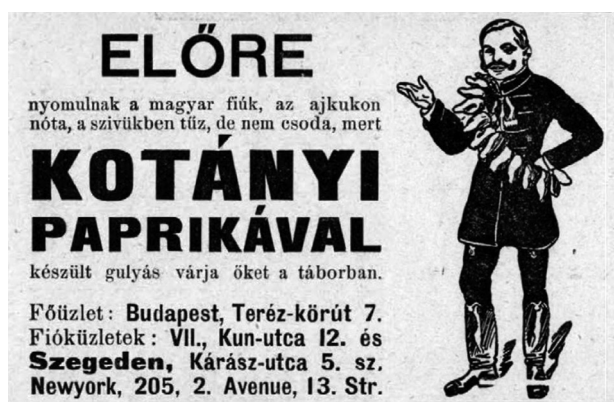
4. ábra. Borsszem Jankó, 1914. augusztus 23., 11.

Az 1914. augusztus 23-i számban megjelent reklám 58 (4. ábra) a kezdeti időszak viszonyait tükrözi, amikor a Monarchiában a városok utcái és a pályaudvarok, a vendéglők és kocsmák megteltek a bevonulók hangos tömegével. Ahogy Komáromi János fogalmaz anekdotagyűjteményében: „Akkor már egy hét óta szakadatlanul talpon volt minden ember a fővárosban.” 59 A csapatok búcsúztatása ország-szerte szinte népünnepélynek számított, és a legtöbbször fényes külsőségek között történt. A katonákat a szeretteik mellett sokszor cigánybanda, zenekar, virágoso kísérték az állomásra, ahol a város vezetői mondtak búcsúbeszédet.