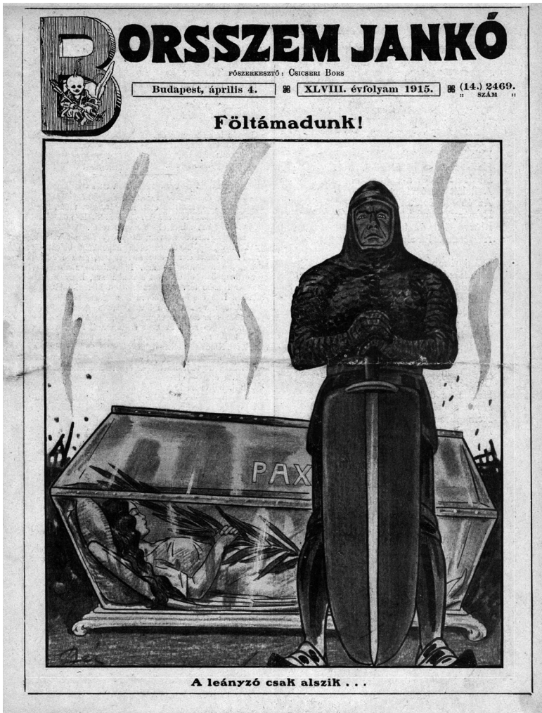
9. ábra. Borsszem Jankó, 1915. április 4., 1.

ez biztosítja a vizuális kapcsolatot a kultusz tárgyával. 76 A felirat szerint a béke, azaz „A leányzó csak alszik...”, nemsokára tehát életre kell, azaz „Föltámad”. Erre a bibliai Jairus leánya történetét 77 idéző rajzra reflektál Kotányi hirdetése (8. ábra). Eszerint a világháború befejezése után, tehát ha a béke feltámad, akkor is Kotányi-paprikát fognak használni a főzéshez.