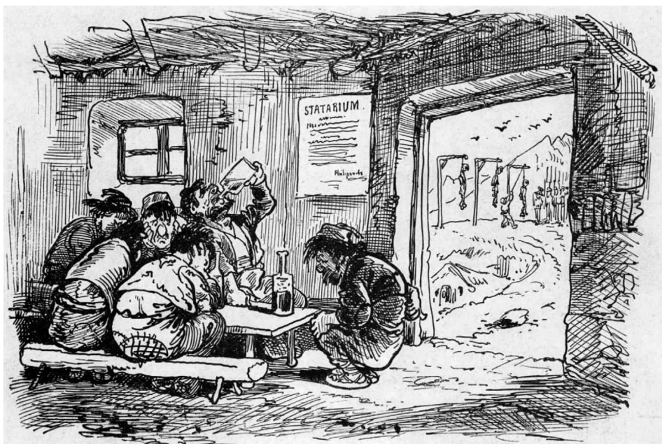
2. ábra. Az okkupáció kultúrája

ábrázolások igen hasonlók: halmokban fekszenek a magyar katonák, akik egyenruhájukról jól felismerhetők. Van, aki már elveszítette életét, mást éppen agyonlőnek a forradalom és szabadságharc harmincéves évfordulójának időszakában. 23 Nem porfelhőbe és mitikus szcenáriókba burkolta Jankó az erőszakot, hanem a vérontást „dokumentálta” saját eszközeivel az élclapok hasábjain. Feltűnt továbbá az az aspektus is, hogy az osztrák erők a magyarokra lőnek, a magyarokat – és nem a bosnyákokat – titulálva forradalmi, lázongó csoportnak. Ez a képzettársítás az ellenzéki lapban gyorsan előhívhatta az 1848–1849-es kollektív emlékeket a fegyverleteltről, a vereségről, a véráldozatokról. 24