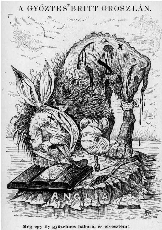
3. ábra. A győztes brit oroszlán

pártatlanul. Brit szereplőhöz köthető egy másik bibliai szimbólum is a harcok ábrázolásakor, amikor Kitchener Káinként egy Bibliával készül lesújtani az ugyancsak a Bibliát olvasó és imádkozó Ábelre. Ez a háború egyenlővé vált az első gyilkossággal, ami súlyos bélyeggel pecsételi meg Kitchenert – üzeni a Bolond Istók . A „Szabadság” feliratú szobron Isten tűnik fel, kezével intó, figyelmeztető mozdulatot téve: a háborús kegyetlenségek nem férnek össze a keresztény eszmékkel. 36