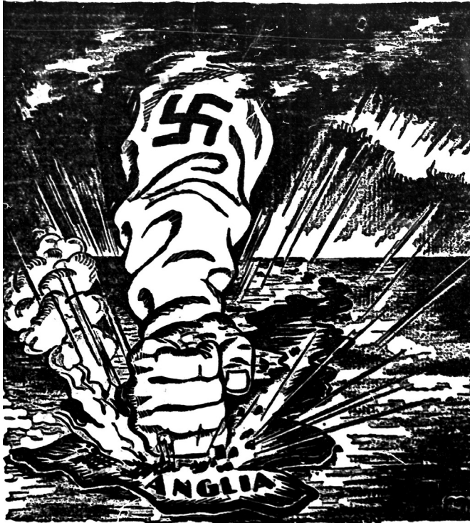
6. ábra. Hitler visszaüt!

Az első világháború elavult, sokszor nem igazán háborúba illő fegyvereit (botokat, töröket, pálcákat) a gúnyképeken felváltották a puskák mellett a tankok, azok pusztításának ábrázolása, illetve a Nagy-Britanniára szegeződő hadihajók. 86 Az új vonások mellett a korábbi vizuális eszközöket is alkalmazták a rajzoló: mitológiai ihletésű képet kevesebbet láthatunk (talán ezek nehezebb érthetősége, lassabb dekódolhatósága miatt), ezeken például Mars szerepel, vagy a Janus-ábrázolásoknál megszokott módon láthatjuk Churchillt békésen, illetve fegyvert szegezve ellenfelére. 87 A római hadisten Churchill és Sztálin nyakában ül, kardjáról csepeg a vér, a szovjet vezető lábával a földgömböt görgeti. A vérontás már a glóbusz minden pontját meghatározza 1941-ben, s ezért Churchill és Sztálin a felelősek – üzeni a propagandakép. 88 Sportjeleneteket is láthatunk a háborús erőfeszítéseket illusztrálандó – ha nem is nagy számban: egyszer a német bokszo- ló legyőzi mindegyik ellenfelét, míg máskor Sztálin már nagyon fáradt, Churchill és Roosevelt edzők próbálják segíteni, ismét csatasorba állítani a szovjet bokszo-