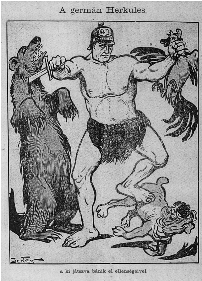
5. ábra. A germán Herkules

4. Sport: birkózás és bokszt – test-test elleni küzdelem. A német és a francia birkózók összecsapását nézik szövetségeseik, egyik oldalon az olasz, az orosz és John Bull, míg a másikon a török, az osztrák és a magyar. A rajz publikálásakor a verduni csata körülbelül két hónapja tartott, de a kép alá írt versike szerint semmi kétség afelől, hogy melyik sportoló fog nyerni. 76 A központi hatalmak egy másik tagja is sikeres a küzdősportban: az „Angol–török bokszt-mérkőzés”-en a török kíméletlenül üti ki a brit fogait. 77