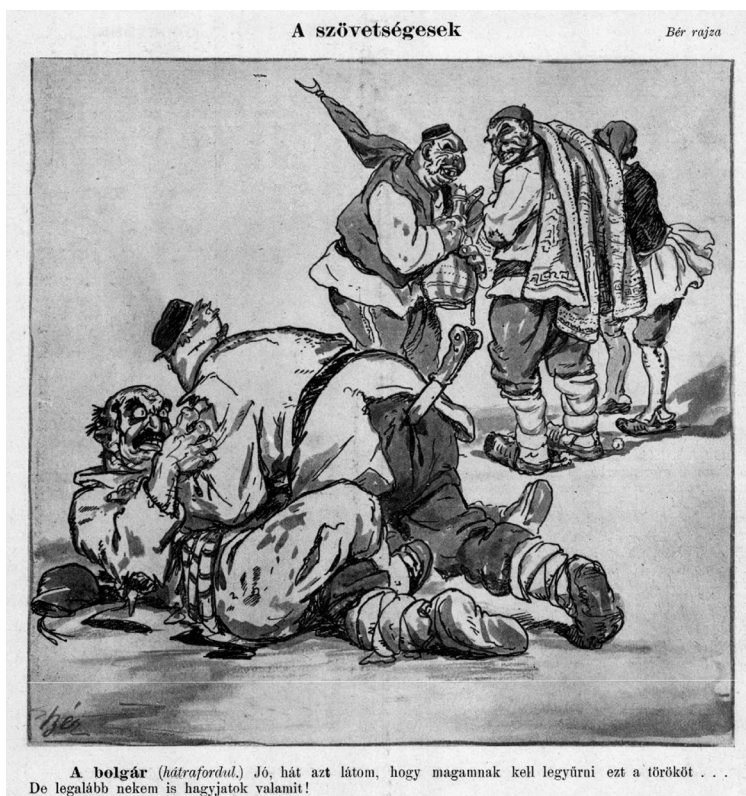
4. ábra. A szövetségesek

A küzdelmeket e háború esetében is vizualizálták állatok segítségével. A balkáni országok hol a törököt, hol pedig egymást marcangolva jelennek meg kutya vagy farkas képében: a megvadult, nyáladzó állatok egymásnak vagy ellenfelüknek esnek. 48 Kevesebb alkalommal, de a marakodást más állatokat felsorakoztató jelenségekkel ugyancsak kifejezték: a baromfiudvarban kakasok – a balkáni országok – viaskodnak, varjak (ugyancsak a balkáni államok) elevenen akarják felfalni a törököt, vagy kosként akasztja össze a szarvát a görög, a bolgár és a szerb. 49 Legnagyobb számban azonban – a búr háborúhoz hasonlóan – nem olyan karikatúrát találunk, ahol az állatok küzdelme testesíti meg a harcokat, hanem olyanokat, amelyeken a balkáni államok a törököt vagy egymást szúrják le tőrökkel, kardokkal, vagy egymást agyonverik pusztá kézzel, esetleg bottal (4. ábra). 50 Eze-