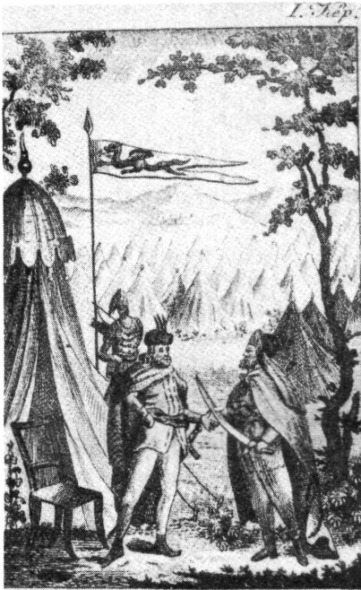
Attila és Pappja.