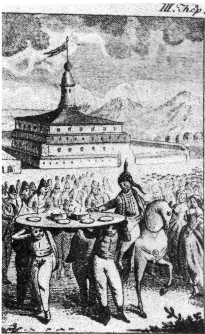
Attila ebédje és háza.