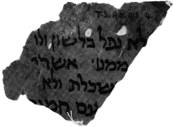
7. T.—S. AS. 213. 4, p. 1a