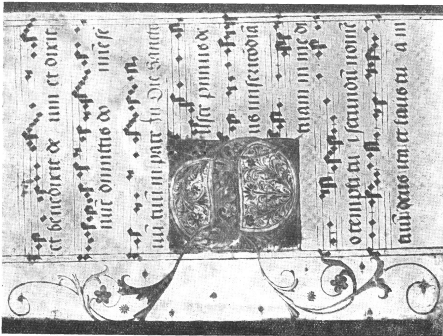
1. Kolozsvári Graduale a XVI. sz. elejéről