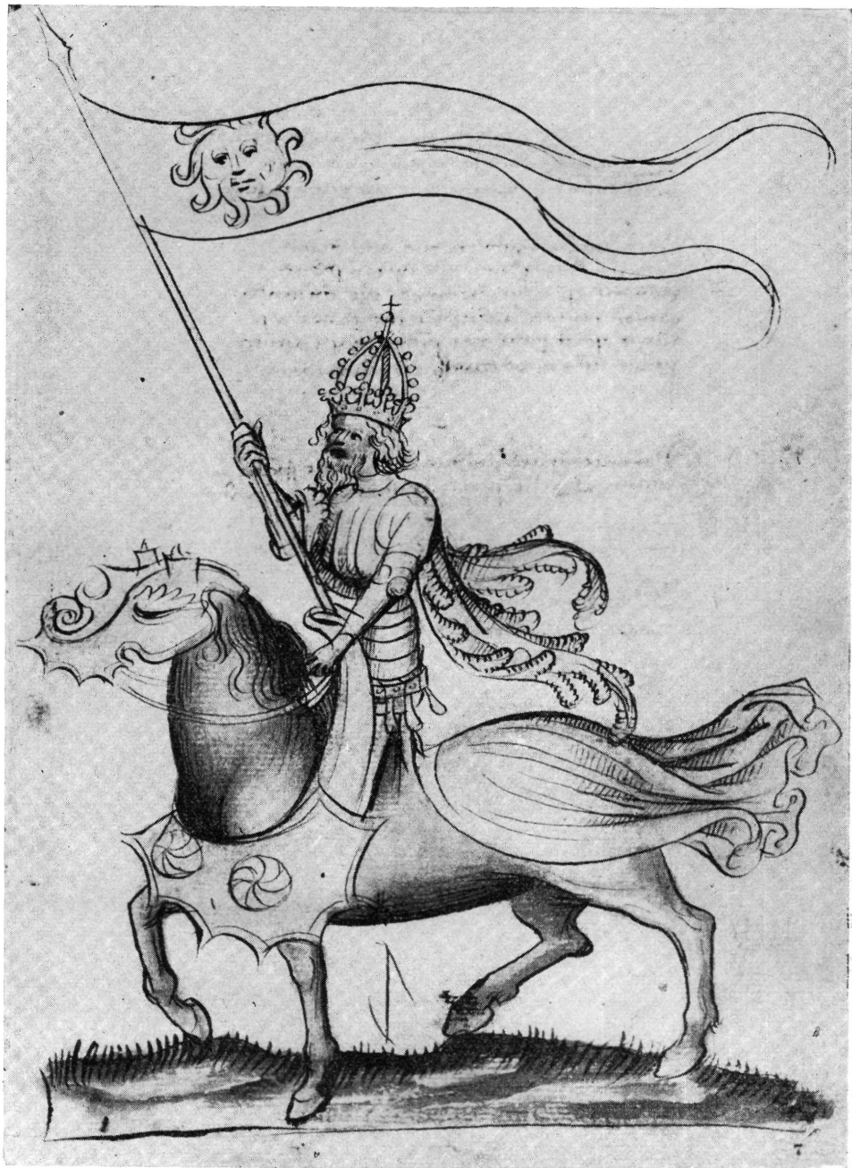
5. Vatikán. Cod. Palat. Lat. 1968.