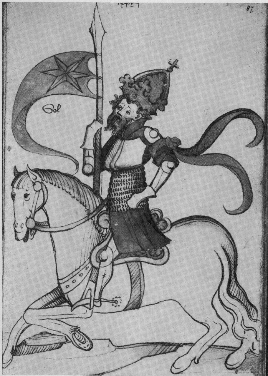
4. Göttinga. Cod. Philos. 64.