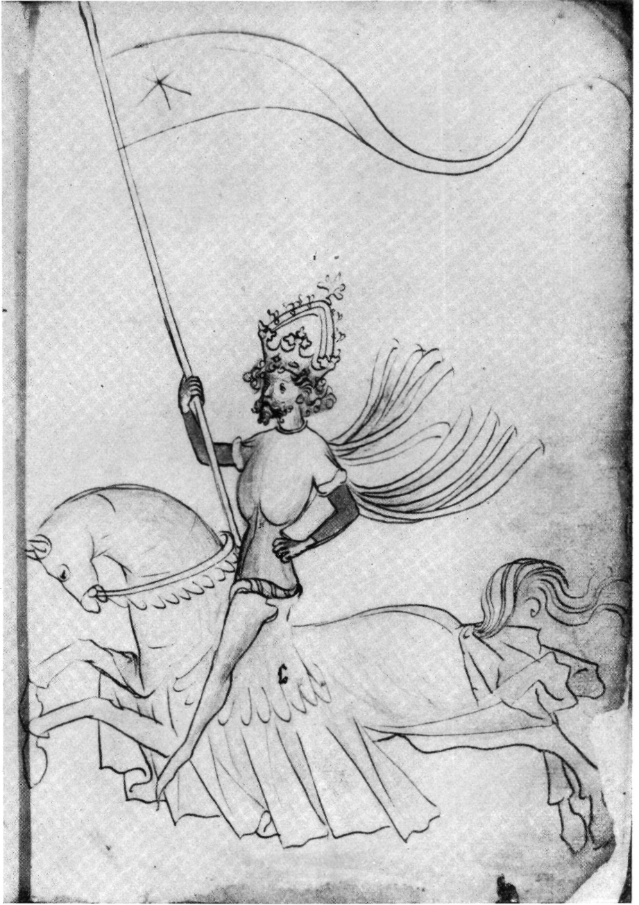
3. Bécs ÖNB Cod. Lat. 5278.