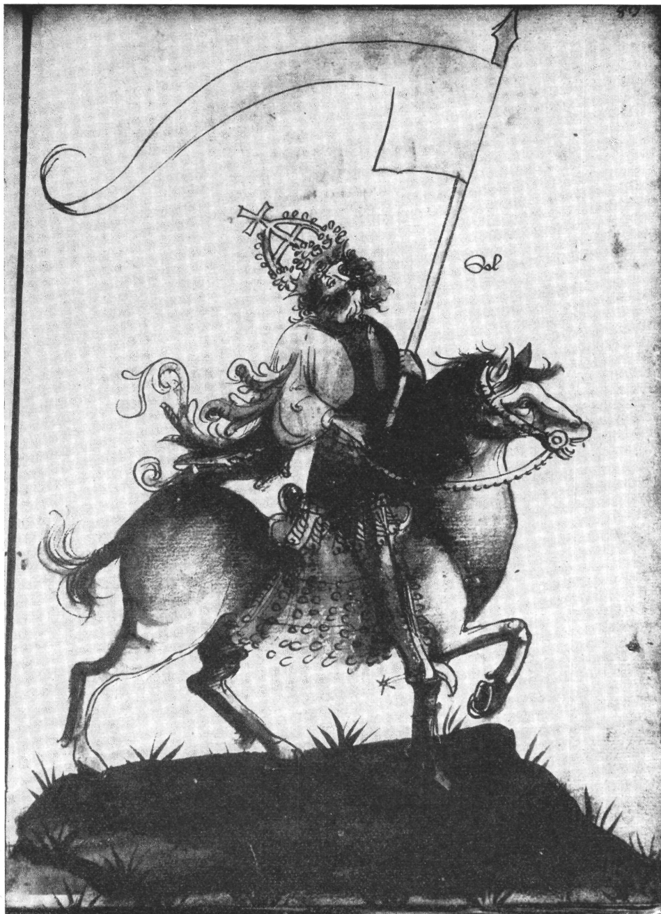
6. Bécs. ÖNB Cod. Lat. 3068.