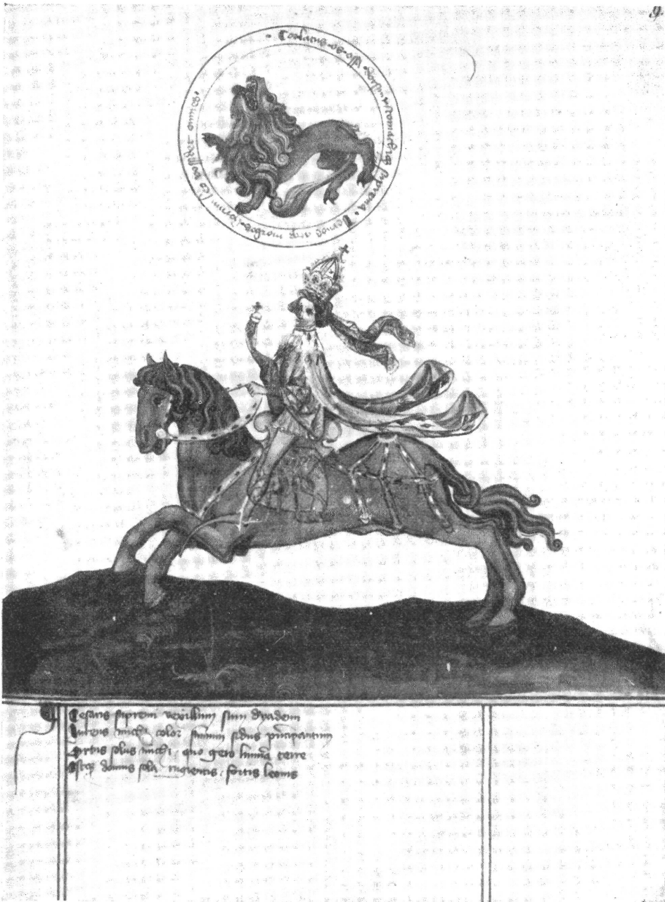
2. Göttinga. Col. Philos. 63.