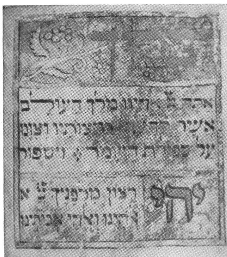
Az első szöveglap