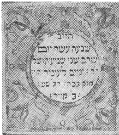
A Szeftira 27. napja