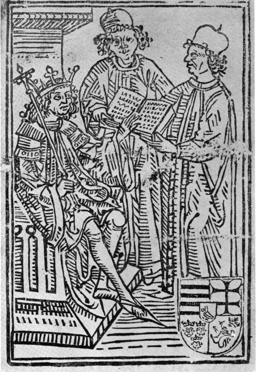
Mátyás király törvénykönyve. A 2. kiadás címlapja